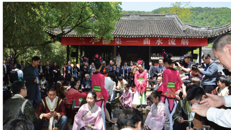
兰亭雅集——曲水流觞现场