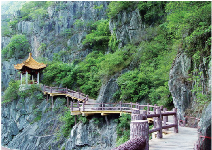
陕西褒城褒斜道南端石门颂门庭道与仿古栈道