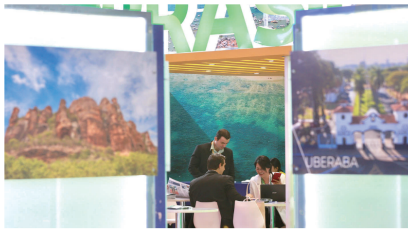
巴西展商在本届京交会上为客户介绍项目

面为世界作出的贡献。“我们曾认为文化和商务是相互平行的两个领域,但二者实际上有着紧密联系。法中两国企业在文化创意、增强现实和虚拟现实、音乐等诸多文化领域,都有相当大的商业合作潜力。”据介绍,10家文化创意领域的法国企业参加了由法国驻华大使馆和北京数字创意产业协会联合打造的“中法文化事业交流平台”,与多家中国企业交流互动,探索合作可能。