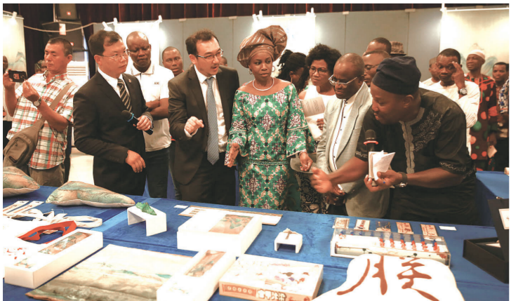
贝宁观众参观故宫文化创意产品

此次文创产品展示活动由中国文化和旅游部策划,是“中国文创产品展示周”的重要活动,文创周从5月10日开幕,持续至6月30日,在全球35家中国文化中心联动推出。“中国文创产品展示周”是海外中国文化中心统一品牌“中国文化周”2018年的活动主题,文创周活动以展览展示为主,结合论坛、研讨、讲座、产品发布、互动体验等多种形式,汇聚成为集文创产品展示、项目推介、产业交流与合作和人才互动为一体的综合性主题文化活动,其中包括“故宫文化创意产品国际综合展”“丝路记忆——NICE Choice 文创海外推广展”“方寸中国——中国集邮文化及文创产品海外推广展”“中国设计·文化·生活体验展”等重点项目。