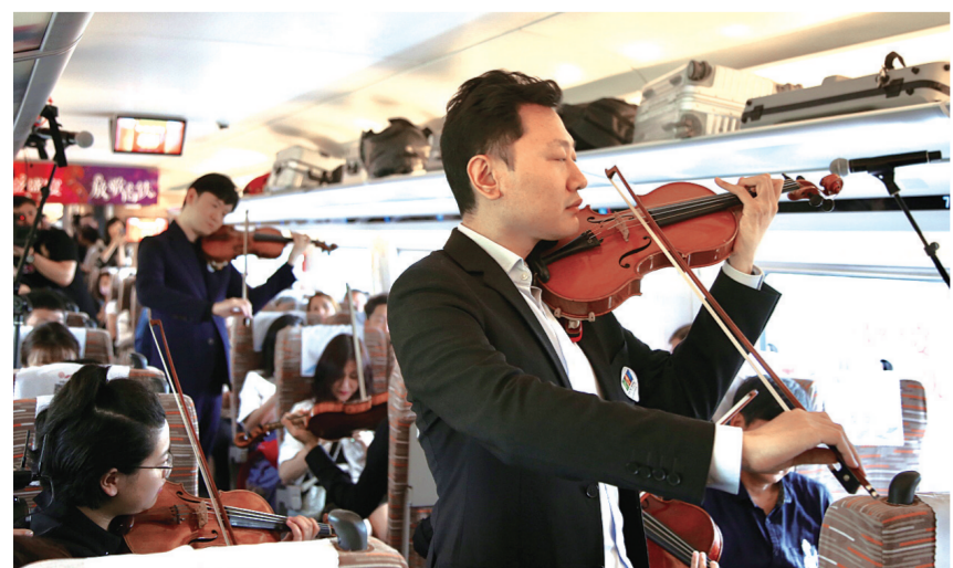
音乐家们在“复兴号”京津城际列车上演出

据主办方介绍，2017年6月，具有完全自主知识产权、代表世界最先进水平的中国标准动车组“复兴号”正式投入运营。2018年5月，正值“复兴号”运营将满一周年的日子，国家大剧院“五月音乐节”公益演出走上“复兴号”，让音乐乘着代表中国速度的“复兴号”飞驰。