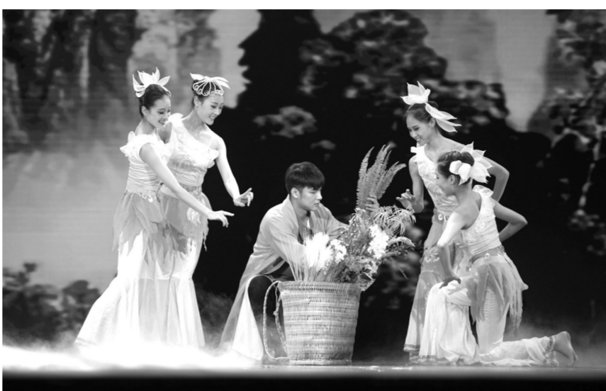
男声独唱《百草心》

了一些较难表达的主题,例如非遗在当下的传承和发展等。“虽然群文作品体量小,表演者大多是群文工作者和普通群众,要创作具有较高艺术难度的传世之作很难,但有些作品以小见大,用深刻的主题、丰富的形式唤醒了我们的某些情愫,令人深思。”上海市群艺馆馆长萧烨说,“有多少个作品,就讲述了多少个故事,展现了多少主题,无论是歌颂英雄,还是展现青年人的追梦故事,悲喜苦乐都在讲述着这座城市及生活在这里的人。”