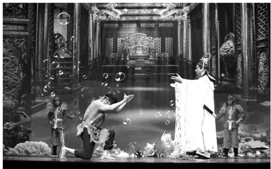
小品《龙王与伏羲》

翻若惊鸿的民乐合奏《洛神赋》、以现代打击乐法演绎的《后羿》……5月28日晚,作为2018年上海市群文新人新作展评展演活动的最后一场专场演出,“开天辟地中华创世神话专场”在上海市群艺馆上演。精彩纷呈的歌舞、小品、曲艺等轮番上演,演员绘声绘色的表演、精致绚丽的舞美赢得了观众阵阵掌声。