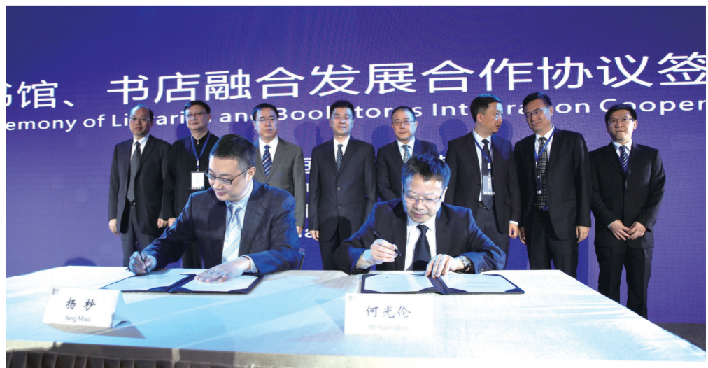
图书馆、书店融合发展合作协议签字仪式现场

协议中明确双方以促进全民阅读、馆店融合发展为目标,充分发挥各自渠道、品牌、资源等方面的优势,通过合作进一步丰富全民阅读内容和手段,共同倡导全社会“多读书、读好书”的良好舆论氛围和文明风尚,提高全民思想道德和文化素质,推动经济社会又好又快发展;双方试点推广“你选书,我买单”的创新服务模式,以公共图书馆行业馆建设标准为基础,通过深入推进公共图书馆法人治理结构改革,引入读者参与图书馆文献建设,加强供需对接;双方合作围绕世界读书日、图书馆服务宣传周、全民读书月以及中华传统节日、重要节假日和重大节庆活动,开展阅读指导、读书交流、演讲诵读、新书展览、书友会等系列阅读推广公益性活动,探索形成符合四川实际的阅读推广方式。