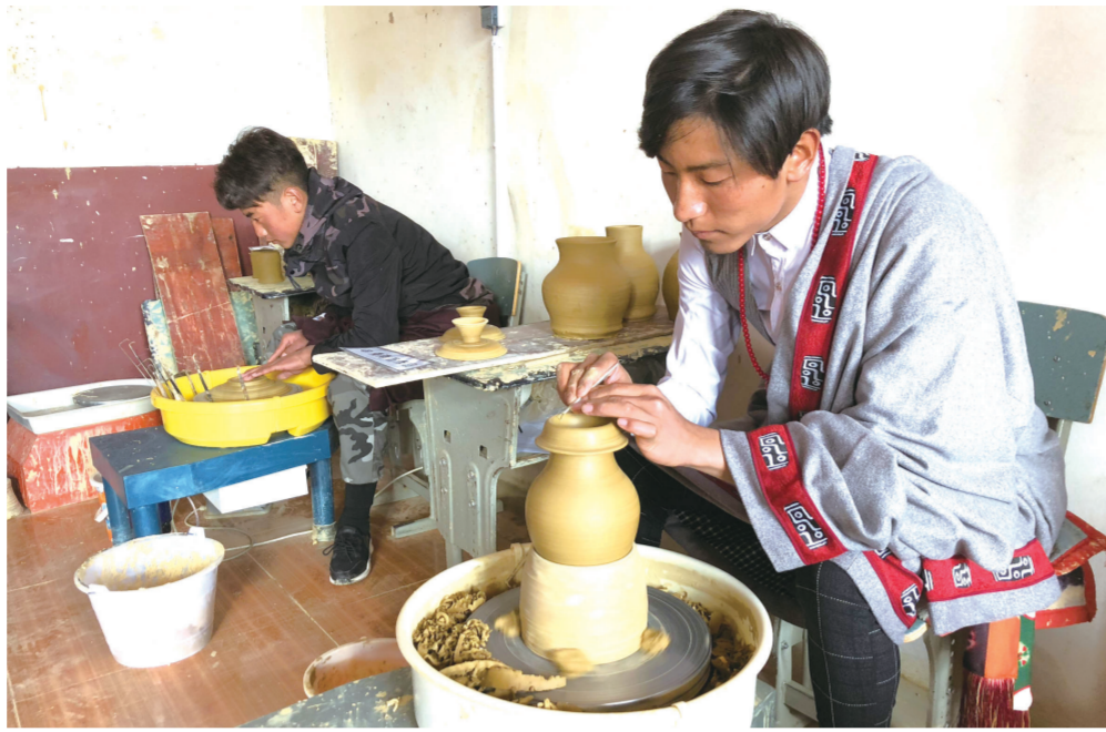
壤塘县壤巴拉藏式陶艺传习所学员正在进行陶艺制作

会议现场,四川省文化厅副厅长赛维平表示,近年来,四川省利用非遗资源优势实施精准扶贫取得了显著成效。充分发挥蜀绣、羌绣、竹编、唐卡等非遗资源优势,带动群众居家就业、增收致富;实施人才培养、技艺创