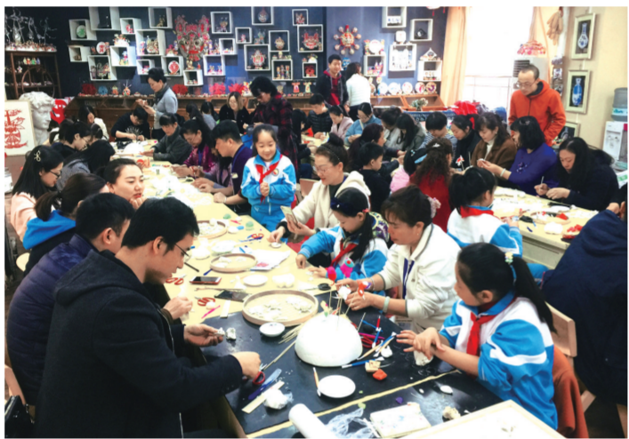
第八期(面花)培训班学员在西安市高新区第二小学与孩子互动交流。