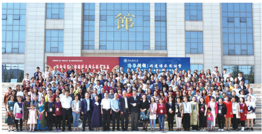
2018年5月3日、4日,近200名学员返回母校,参加“跨界创新:非遗传承对话会”并合影留念。

“我们愿意与各位学员合作,把陕西的非遗项目设计成新的网络表情包,推广传播中华优秀传统文化。”曾凭借着把国家级非遗项目凤翔泥塑做成表情包而备受追捧的法国姑娘美珊日前来到陕西师范大学长安校区,并为非遗传承人研培计划陕西师范大学文学院历届培训班的200余名学员带来了非遗“时尚再加工”的合作及宣传方案。