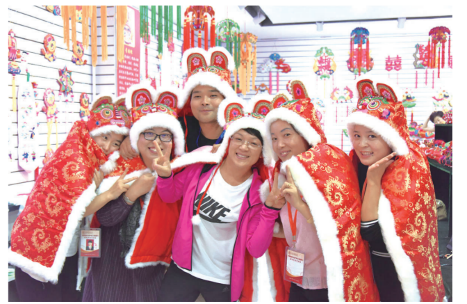
第二期(刺绣)培训班学员在千阳县某绣品店体验儿时乐趣。

陕师大文学院院长、“长江学者”张新科表示,学院将充分利用非遗传承人研培计划的资源优势,凝练学院的人才培养特色,在学院成立面向学生的非遗项目传习所,设立传承项目实践工作坊,围绕传承项目开展国内外交流和科学研究,辐射和带动周边中小学和社区开展非遗普及教育活动,进一步弘扬中华优秀传统文化。