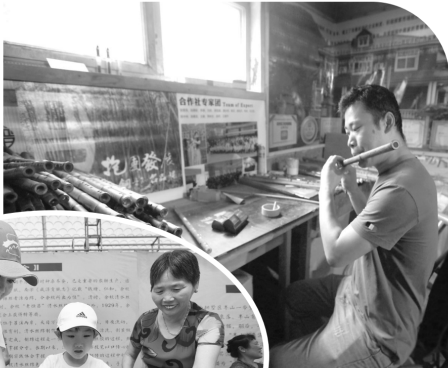
▲ 工匠在为做好的竹笛调音