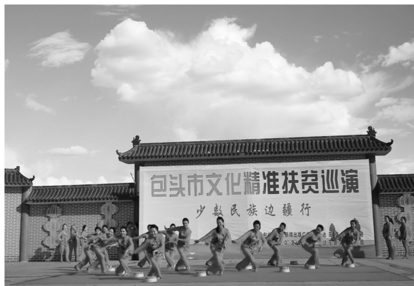
包头群众文化学会舞蹈团精彩演绎舞蹈《搓衣面》

包头铁路第二中学音乐教师姜楠自2017年内蒙古“唱响北疆”呼包鄂歌手大赛脱颖而出后,便加入了包头市文艺志愿者队伍,已经十几次跟着包头市“文化精准扶贫巡演少数民族边疆行”到农村、牧区演出。本次演出,一