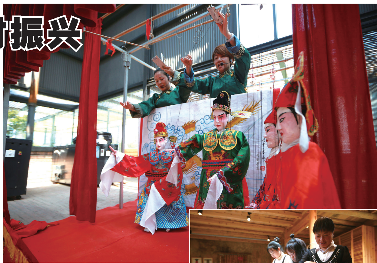
▲ 红糖工坊成了全村人的文化礼堂。

在松阳，地域文化是文创产业发展的优势所在。松阳县采取“非遗+旅游”“非遗+互联网”等方式，引导非遗项目、传统“百工”向“老街乡愁”片区集聚，引导非遗传承人开展活态传承和特色经营，开发文创产品、文化消费产品；已鼓励开发杆秤、铁器、篾器、红糖、手工布鞋、麦秆扇等20余个传统手工艺产品，成功包装了“诚天和”“茶叶熏腿”“仙人源”松阳端午茶、“云缙坊”印染等非遗品牌，让非遗实现产业化融合发展。