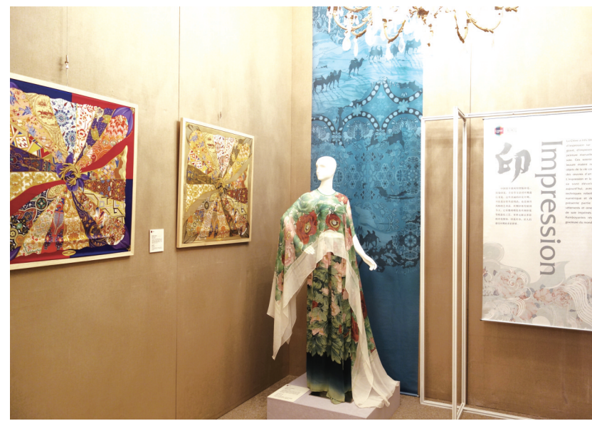
“再造：中国丝绸技艺与设计”展之“印”单元

据了解，作为全国首批博物馆文化创意产品开发试点单位之一，近年来，中国丝绸博物馆在“十二五”国家