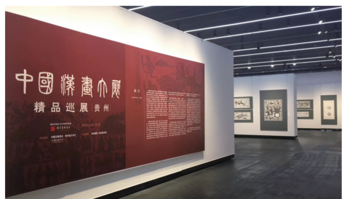
“中国汉画大展精品巡展”贵州美术馆展厅现场

撰写此文时正值“中国汉画大展精品巡展（贵州）”开幕，这些精彩纷呈的展览作为美术馆的核心组成部分，给贵州公众带来了美的欣赏和精神大餐，相