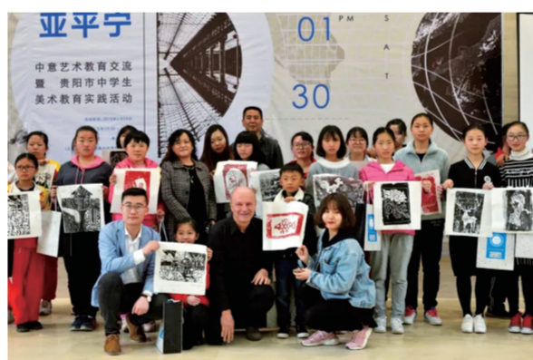
“走进亚平宁——中意艺术教育交流暨贵阳市中学生美术教育实践活动”在贵州美术馆举行