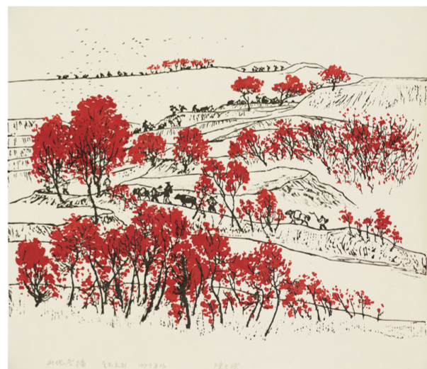
山地冬播（版画）一九五九年 陈天然

播交流推广资助项目评审中获得立项，并将在全国多地地进行展出，此次在黑龙江省美术馆的展览为巡展的第二站。黑龙江是版画艺术发展的重镇，期望通过此次展览，对版画艺术的美学内涵和历史价值进行视觉呈现和直观阐释，推动当代版画创作的繁荣发展，并以巡展为契机，开展学术交流，促进不同地域之间文化艺术的繁荣发展，助力公共文化服务体系的建设。（梁鹏）