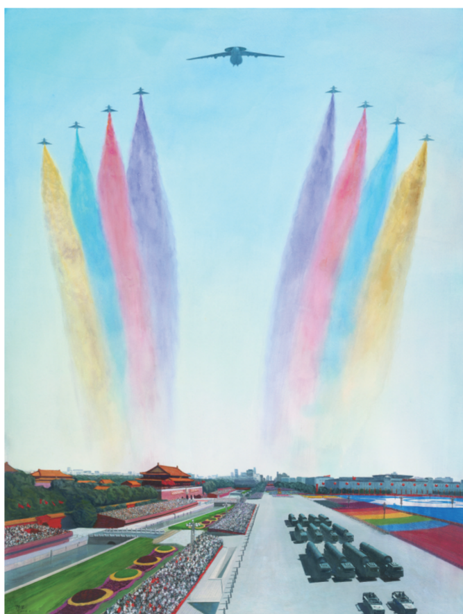
二〇一五年九月三日大阅兵(水彩) 180×200厘米 2016年 陈坚

廖俊波生前是福建省南平市委常委、副市长，武夷新区党工委书记，他入党25年来，始终信念坚定、不忘初心，对党和人民无限忠诚，在每一个工作岗位都倾心尽力为党和人民事业奋斗，以良好的形象和口碑赢得了党员、干部和群众的广泛赞誉，2015年6月被中央组织部授予“全国优秀县委书记”称号。2017年3月18日，廖俊波不幸因公殉职。他任期间，牢记党的嘱托，尽心尽责，带领当地干部群众扑下身子，苦干实干，以实际行动体现了对党忠诚、心系群众、忘我工作、无私奉献的优秀品质，无愧于“全国优秀县委书记”的称号。