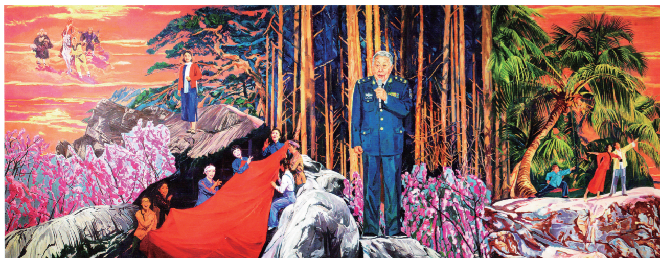
党的文艺战线忠诚战士——阎肃(油画) 300×800厘米 2017年 焦小健 胡蓉蓉 游迪文 席华侨

作品所描绘的情节与内容完全出自作者的亲身经历。在刚刚迎来解放的北京街头，一群孩子正在跟一位军管会的女同志学习唱歌。朦胧的城楼上悬挂着毛泽东画像，葱绿的树丛沐浴着温暖的阳光，蓝天映衬着飞翔的风筝，营造出了北京刚解放时那欢快与祥和的气氛。从孩子们极其投入的神情与满面的笑容里，看到了他们对新中国的憧憬与希望。真实的环境、亲切的场面、朦胧的气氛使这一重大主题以轻松的抒情效果出现在你的面前，把人带入《没有共产党就没有新中国》这首著名的革命历史歌曲的旋律之中。