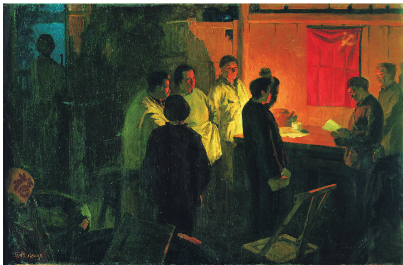
入党誓词(油画) 118×170厘米 1950年 莫朴 中国美术学院美术馆藏

《入党誓词》表现的是“大革命”之后的特殊场景。1927年，国民党反动派杀害了许多共产党员。在这样一个危险时刻，仍然怀着坚定的共产主义信念的战士，在昏暗的小屋内，点着油灯，照亮党旗，冒着随时被“杀头”的危险，勇敢加入中国共产党。这是多么可歌可泣的入党誓词！莫朴青年时期即投身于革命，“七七”事变后，还是上海美专学生的莫朴毅然拿起画笔积极投身抗战宣传，后历经艰难困苦辗转投奔了第四军，于1943年到达延安，任“鲁艺”美术教员。作为老战士、老党员，莫朴表现的入党誓词场景让人看到了共产党人的坚定执着。