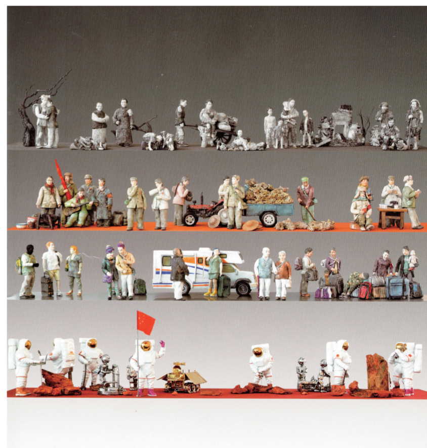
百年中国梦(雕塑) 100×40×25厘米 钱子艺 钱子伟

2015年9月3日，是中国人民抗日战争暨世界反法西斯战争胜利70周年纪念日。在那场惨烈的战争中，面对侵略者，中国人民在中国共产党领导下，不屈不挠、浴血奋战，彻底打败了日本军国主义侵略者，铸就了战争史上的奇观。水彩画《二〇一五年九月三日大阅兵》画面上的多彩天空表达了中国人民对和平的美好向往，彰显出中国走和平发展道路的强大决心。