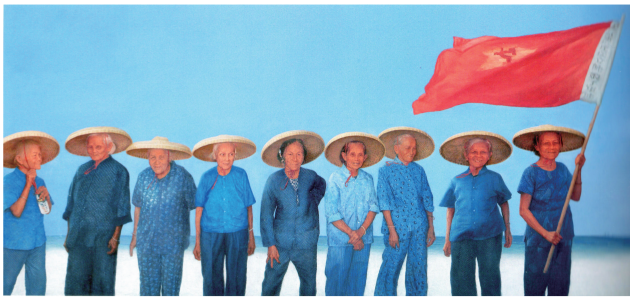
红色娘子军之歌(油画) 180×390厘米 李汉波

阎肃生前是原空军政治部文工团创作员。他从艺65年，始终坚定爱党报国的理想信念，牢记以人民为中心的创作导向，把弘扬时代主旋律作为崇高使命，把真诚为民为兵服务作为使命追求，创作了《江姐》《我爱祖国的蓝天》等一大批脍炙人口的红色经典，影响和激励了几代中国人。党的十八大以来，他以80多岁高龄追梦筑梦、辛勤创作，参与策划多场重大文艺活动，为讴歌主旋律、汇聚正能量，繁荣发展社会主义文艺作出了突出贡献。