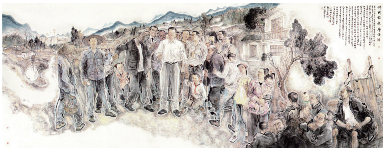
全国优秀县委书记——廖俊波(国画) 300×800厘米 2017年 张水海 赵胜利 文亚坤

1931年5月的一天，在海南省琼海市万泉河畔一个椰林环抱的小山村，‘中国工农红军第二独立师女子特务连’召开了成立大会。100多位穷苦的农村女孩子，为反抗封建压迫和争取男女平等，在共产党组织领导下，勇敢地拿起了枪。80多年过去了，年轻一代尽管无法切身感受到革命先驱的青春岁月，但不应忘记革命成果的来之不易和老一代的革命精神。作者对红色娘子军老人形象的塑造，给人以莫大的感动和鼓舞。