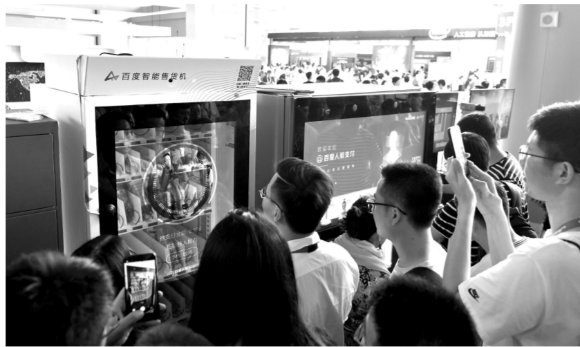
与会者在百度AI开发者大会的会场外体验百度人脸支付功能

在今年“5·18国际博物馆日”中国主场活动上,国家文物局与百度公司共同启动了AI博物馆计划。该计划包含智能搜索、智慧地图、图像识别、语音交互、机器翻译、AI教育等功能模块,将通过百度搜索、熊掌号、百度地图、百度百科等多个产品实现落地。目前已与秦始皇帝陵博物院、苏州博物馆及上海市历史博物馆达成合作。“观众走进博物馆,看到感兴趣的文物只要拿起手机打开百度APP对准一拍,就可以自动识别文物并展示该文物的详细信息,相关信息借助语音合成技术还能够播报出来。哪怕是国外游客也不用担心语言不通的问题,在百度翻译助手的帮助下,所有信息都可以用他们熟悉的文字展示并播报。在浏览过程中有任何关于文物的问题,也可以与虚拟的小度机器人进行互动,了解更详细的信息。依托强大的人工智能,小度机器人集成了自然语言处理、对话系统、语音视觉等技术,能够自然