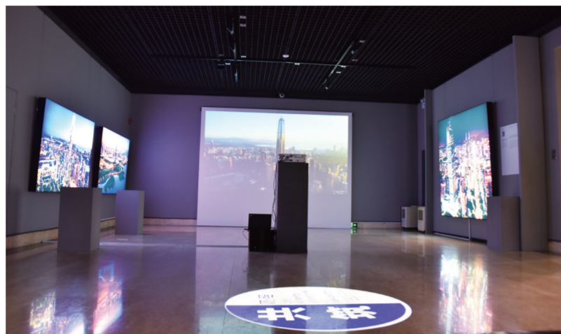
赖雅君互动影像作品展览现场