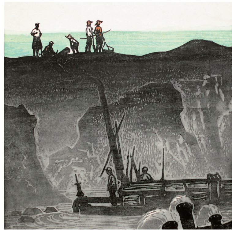
一片新绿(版画) 吴俊发