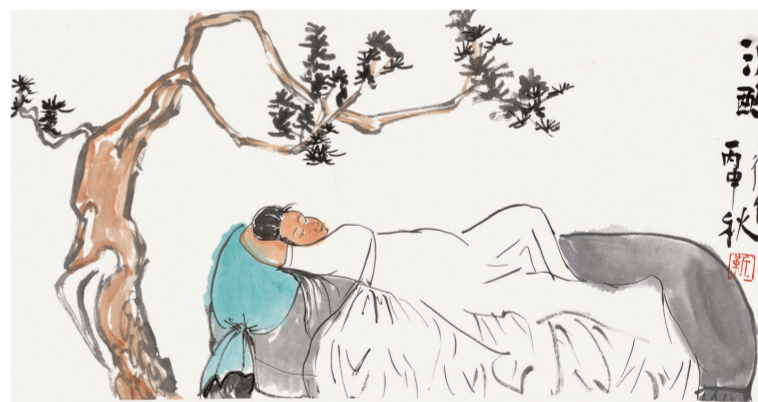
沉醉(国画) 2016年 新卫红

这种“笔墨纸砚”及文人书房整体场景的呈现方式，在强调考古现场整体保存的文博类展览中已不鲜见，但将这一形式置于美术馆当代水墨的展览空间中，无疑呈现出一个更加鲜活的、行进中的当代文人生活的完整场域。(木木)