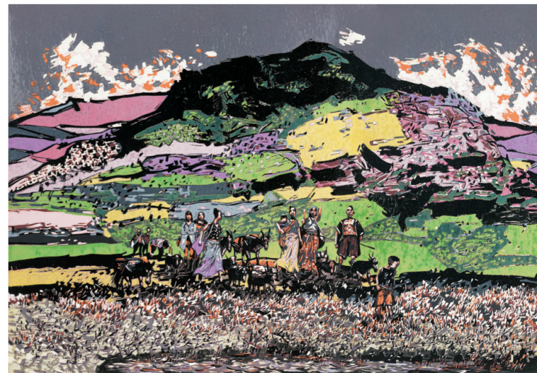
希望的田野(版画) 2017年 贺昆

据悉，重庆是“桃花盛开——2018首届中国版画作品展”继江苏大剧院首展后全国巡展的第一站。展览将持续至7月29日。(美周)