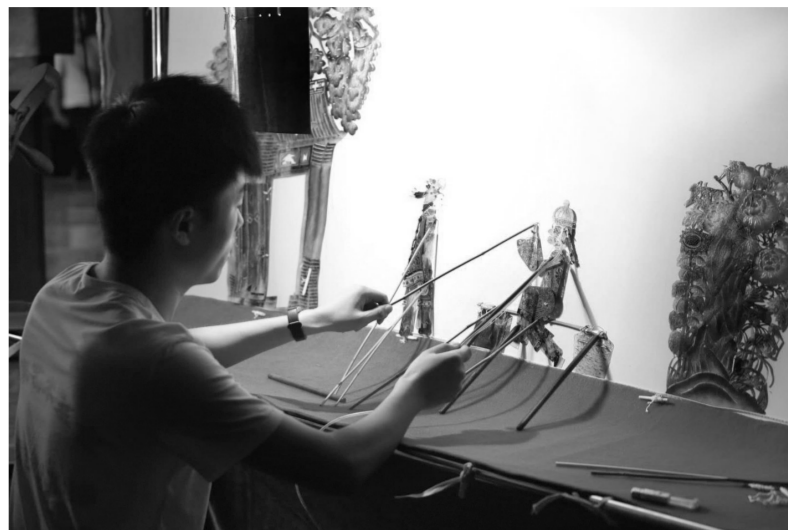
大学生学员表演传统皮影折子戏《卖杂货》

本报讯(驻陕西记者任学武)由国家艺术基金指导、陕西渭南师范学院主办的国家艺术基金2017年度“皮影戏艺术人才培养”项目成果展演暨研讨会日前在陕西西安举行。“皮影戏艺术人才培养”是渭南师范学院首次获批的国家艺术基金资助项目,也是陕西省属地方院校获批的首个国家艺术基金资助项目。