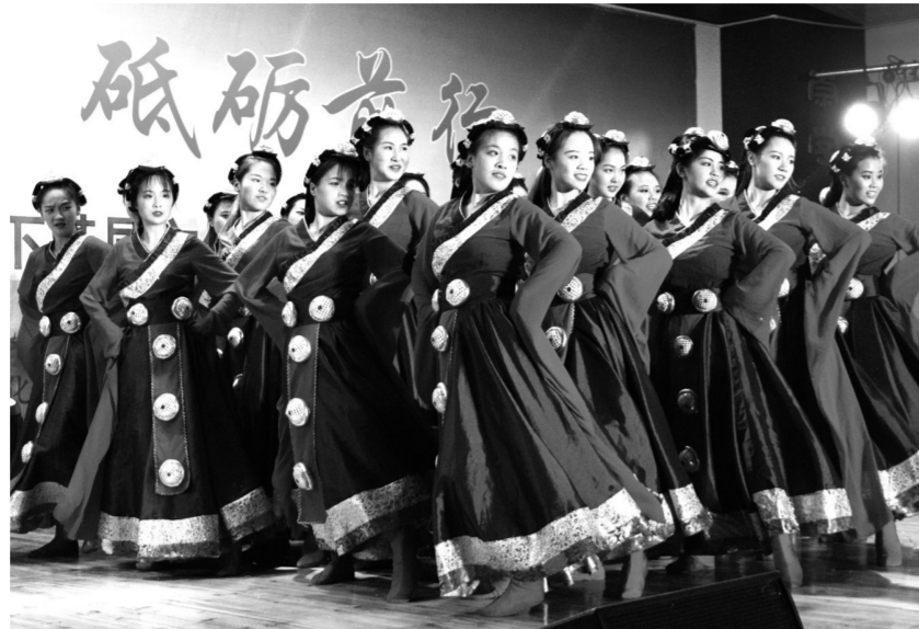
乡镇文化员定向班学生暑期在浙江省丽水市庆元县黄田镇竹口村演出

为满足基层人民群众日益增长的精神文化需求,浙江省基层公共文化服务岗位急需一批“下得去、用得着、留得住、受欢迎”的专业人才队伍。2017年,浙江省委宣传部、省教育厅、省财政厅、省人力资源和社会保障厅、省文化厅共同发出《关于开展定向培养乡镇文化员试点工作的通知》,委托浙江艺术职业学院定向招收了第一批乡镇文化员。“定向培养乡镇文化员工作事关现代公共文化