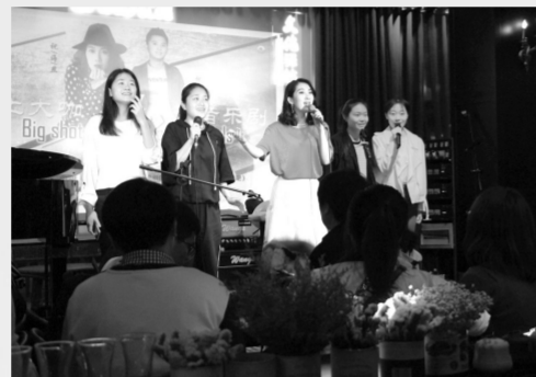
在温州市流行乐团承办的文化驿站中举行的本土音乐人谈音乐剧活动

间,广泛吸纳社会资本对乐团的演出进行赞助,而温州市流行乐团也在走向大众的过程中赢得了尊重。