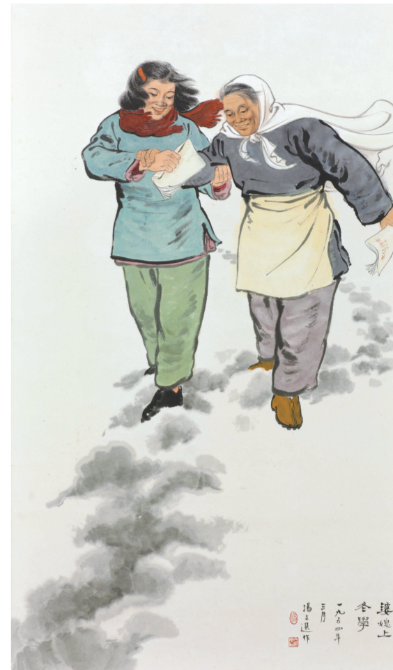
婆媳上冬学(中国画) 115厘米×67厘米 1954年 汤文选 中国美术馆藏