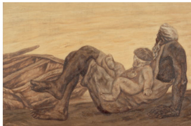
爷爷的河(油画) 115厘米×175厘米 1984年 尚扬 中国美术馆藏