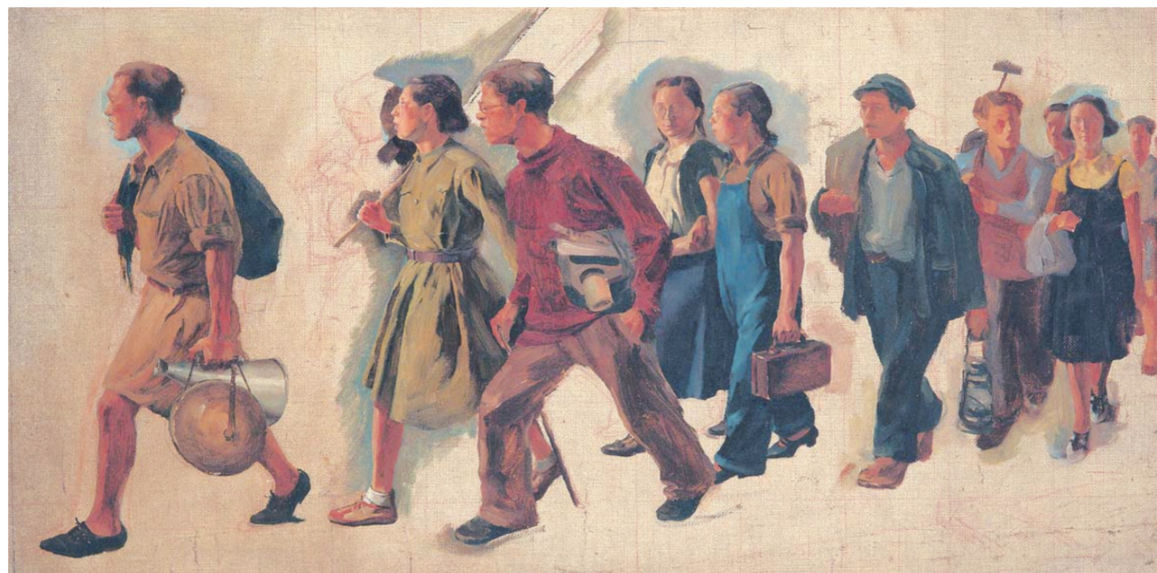
七七的号角(油画) 33.3厘米×61.2厘米 1940年 唐一禾 中国美术馆藏