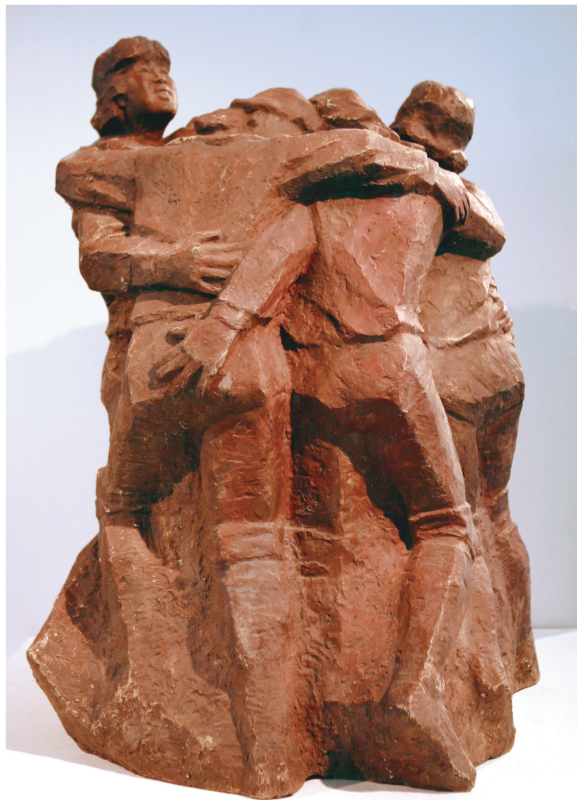
热泪(雕塑) 94厘米×75厘米×74厘米 1984年 朱达斌 湖北美术馆藏