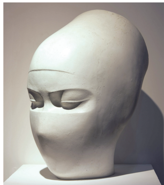
生命使者(雕塑) 60厘米×50厘米×34厘米 1984年 傅中望 湖北美术馆藏