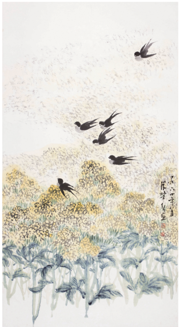
燕子油菜花(中国画) 150厘米×82厘米 1964年 张肇铭 湖北美术馆藏