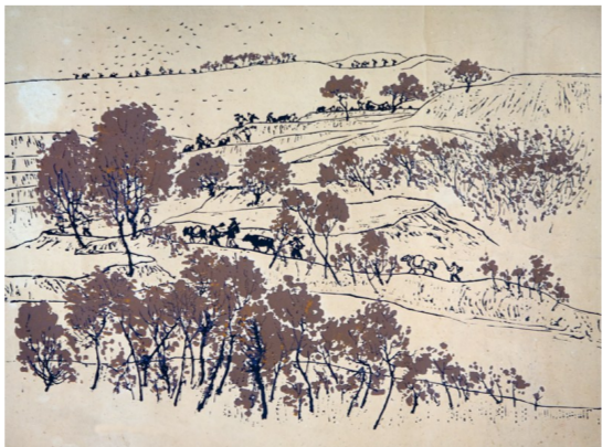
山地冬播(版画) 40厘米×46厘米 1958年 陈天然 湖北美术馆藏