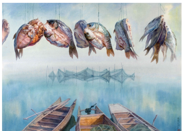
腊月(水彩) 65.5厘米×92厘米 1994年 白统绪 湖北美术馆藏