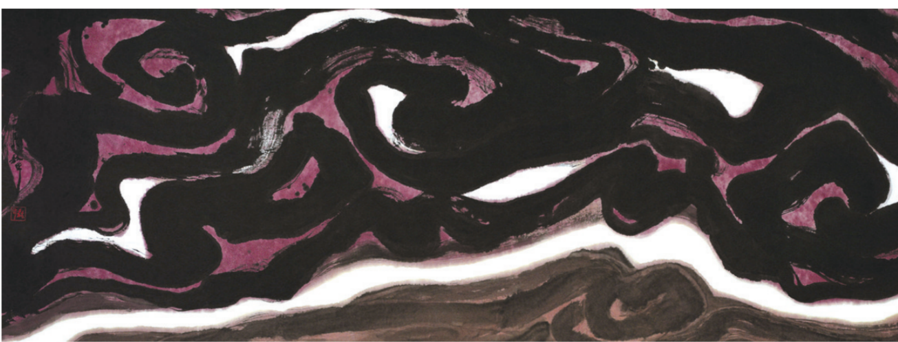
九龙秀江(中国画) 144厘米×365厘米 1998年 周韶华