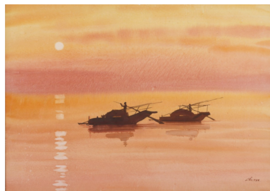
渔舟唱晚(水彩) 57厘米×88厘米 1988年 魏正起 湖北美术馆藏