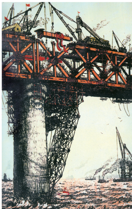
最后一根钢梁(版画) 80.5厘米×53.5厘米 1957年 袁石 湖北美术馆藏