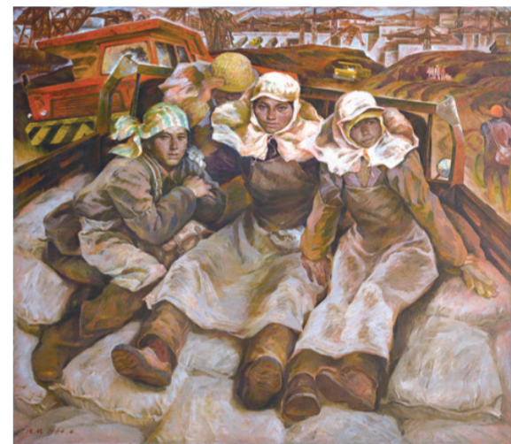
工地上的母亲(《葛洲坝人》三联画之一)(油画) 140厘米×157厘米 1984年 唐小禾 程犁