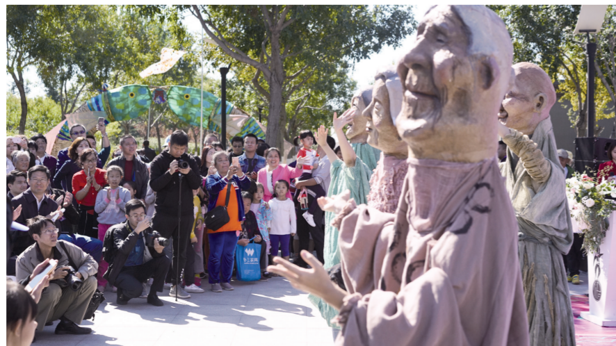
观众在台湖公园观看影偶表演

艺术周论坛以“新时代的影偶传承与发展”为主题，围绕当今世界影偶发展趋势、中国影偶的现状与前景、影偶与中国当代戏剧舞台等话题展开讨论，并邀请专家学者及相关的艺术从业者基于目前国际、国内戏剧的发展趋势，围绕影偶戏的创作、表演、导演等方面，提出推动我国影偶艺术发展的思路与建议。