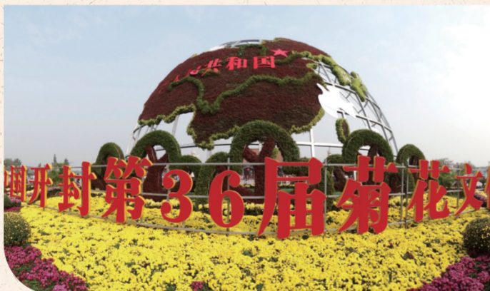
河南开封第36届菊花文化节现场

◆专家观点：在河南大学黄河文明与可持续发展研究中心教授、中原民俗与文化研究所所长彭恒礼看来，在开封，重阳赏菊从古代民俗发展成为特色名片，颇受老百姓欢迎，关键是坚持了“文化之魂”。无论世界发生多大的变化，生活如何日新月异，只要文化魂魄在，文化就能一直延续下去。“开封菊花文化节是古代民俗文化与现代文化产业对接的结果，在对接过程中，开封市注重调动民间的积极性，鼓励民众参与。”彭恒礼认为，这种方式正是民俗文化与现代文化旅游产业对接的正确思路。