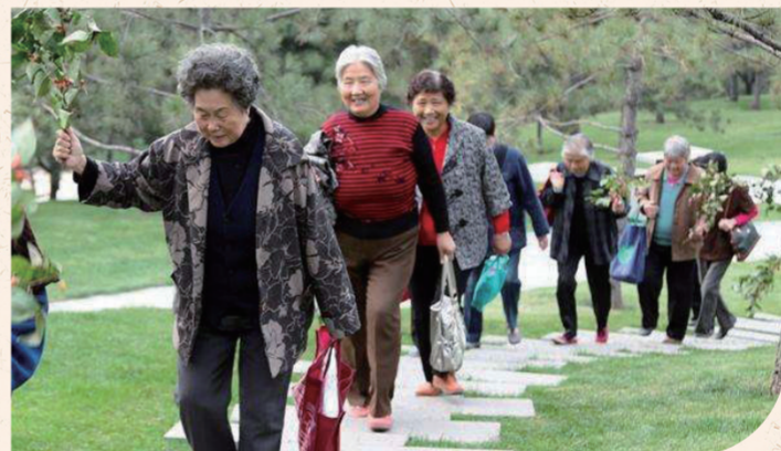
重阳登高的老人们

10月14日，一年一度的重阳登高祈福活动在山西省运城市万荣县稷王山如火如荼地进行，游人如织，分外热闹。登高活动为期15天，以传统庙会为主，伴以饮菊花酒、吃重阳糕、制作茱萸香囊等传统重阳节习俗。