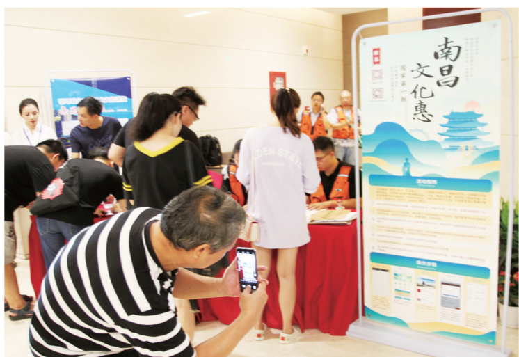
南昌文化企业注册江西银行客户端南昌文化惠