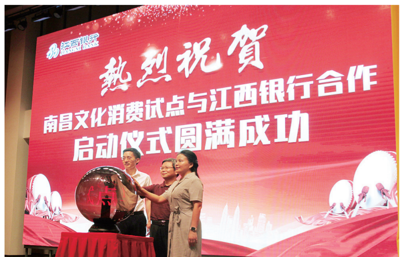
江西省文化厅副厅长郎道先、南昌市委副书记龙国英、江西银行董事长陈晓明共同点亮水晶球。

近年来,南昌作为历史悠久的世界名城,积极促进文化产业健康发展,着力加强文化消费供给,努力培育文化消费理念,积极引领健康向上的文化消费方向,逐步摸索出一套文化产业健康发展的“南昌模式”,为打造江西富饶美丽的“南昌样板”提供了坚实的文化保障。