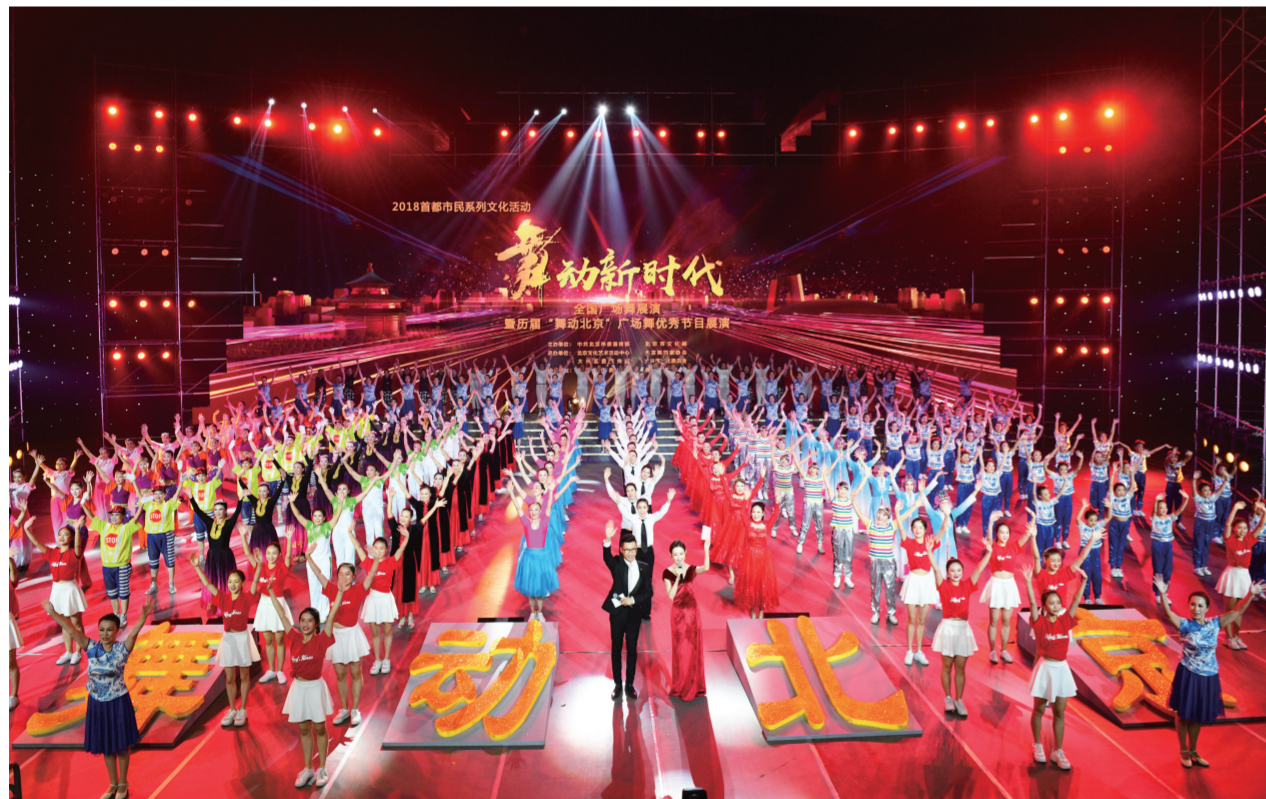
舞蹈《美丽中国站起来》

舞动新时代,大家跳起来。“舞动北京”将继续发挥示范引领作用,不断提升全民艺术素养,弘扬主旋律,传递正能量。