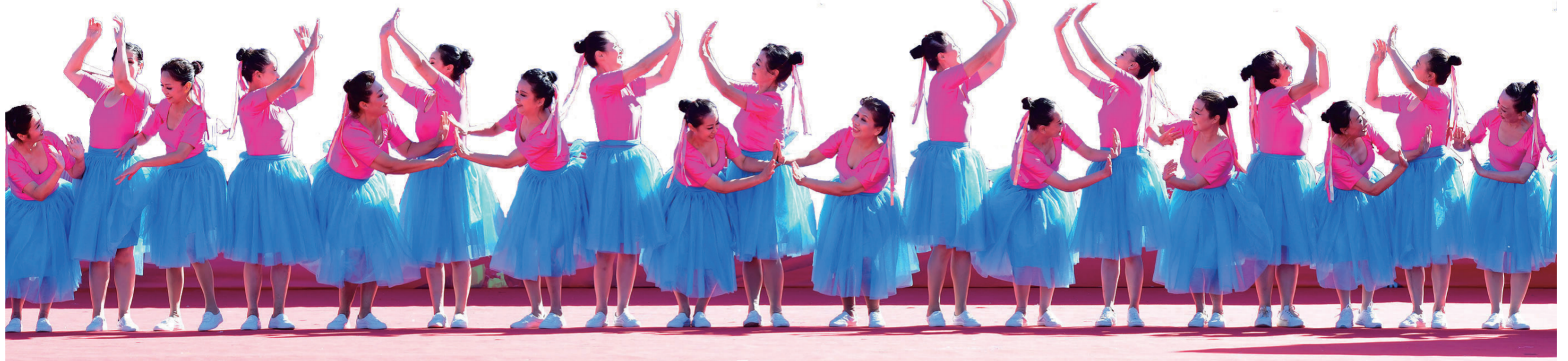
舞蹈《新幸福拍手歌》

舞翩跹,满城欢。为深入贯彻落实习近平新时代中国特色社会主义思想,围绕庆祝改革开放40周年,带动群众性文体活动蓬勃开展,凝聚起同心共筑中国梦的磅礴力量,全面推动全国文化中心建设,根据中宣部、文化和旅游部、国家体育总局关于开展全国广场舞展演活动的总体部署与要求,由北京市委宣传部、北京市文化局主办,北京文化艺术活动中心等单位承办的2018年首都市民系列文化活动的之历届“舞动北京”广场舞优秀节目展演近日落下帷幕,吸引了上百万市民踊跃参与,成为北京最接地气的群众文化活动之一。