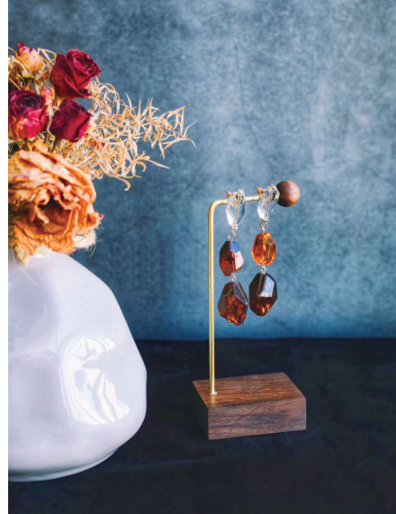
创意饰品打通青春创意之路