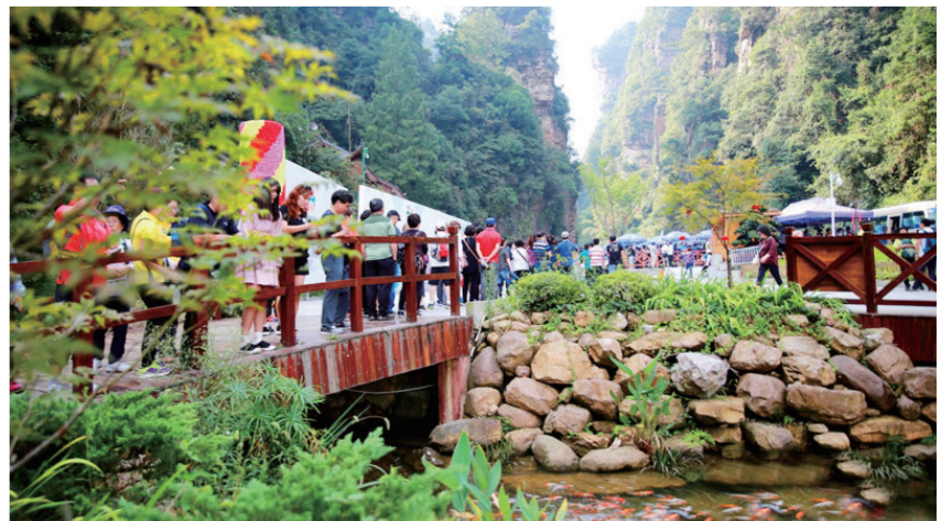
高质量的景区管理让老百姓玩得开心,玩得舒心。

戴斌说:“目前,中国还处于大众旅游发展的初级阶段,人民需要更多的公益性公园,需要更多的低门槛郊野公园。对于融入城市环境中的国有景区,特别是利用自然和历史文化资源的景区,应该更加强调其公益性,进一步下调门票价格甚至让市民和游客免费进入。我们应当,也有能力让更多国民分享旅游发展的成果。”