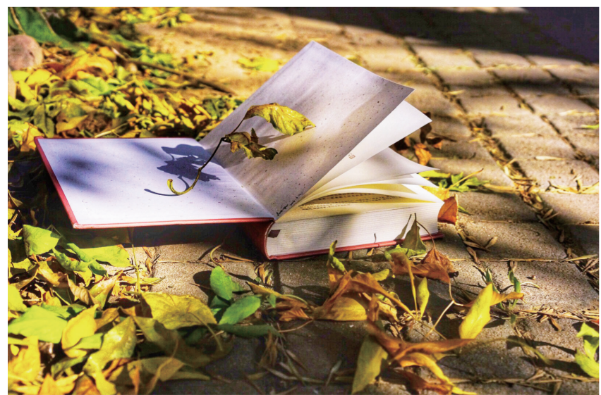
金秋十月,北京文学成为一道亮丽的风景。

作家石一枫认为,塑造人物始终为写作的第一要义,“在写作过程中,既要‘贴着人物写’,又能发现人物与时代之间的勾连关系,讲出专属于今天的中国故事。”他相信,真正的典型人物都是时代的新人物。比如他创作的《特别能战斗》中的苗秀华,这种大妈,在美国没有,在英国找不到,过去的中国也没有,只有今天的中国才有这样的大妈,“她们虽然岁数大,但是时代意义是全新的。”