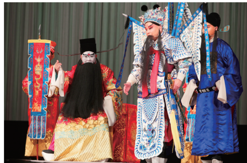
京剧《关云长忠义千秋》剧照