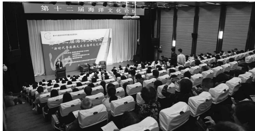
第十二届海洋文化论坛现场

为更全面、更深入地推广全民阅读,盐田区图书馆于11月13日组织召开了“小桔灯”阅读推广计划第三个五年计划及推荐书目专家座谈会,探讨儿童阅读启蒙、阅读教育与阅读实践活动,创新和提炼儿童阅读推广的运作机制。当天,盐田区图书馆建馆15周年座谈会同步召开,图书馆界的专家学者、读者代表就盐田区图书馆未来的发展进行了探讨和展望,并表达了携手迈向盐田文化发展新征程的美好愿望。