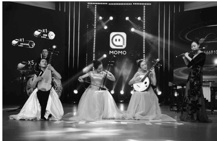
艺术家们在“金秋琴韵”专场中合奏金庸武侠电影主题曲《沧海一声笑》

除了曲目的创新,演奏过程中,网络直播平台还增加了互动和点播,让只能端坐在音乐厅舞台上的艺术“活”了起来:“铜管五重奏”专场演出