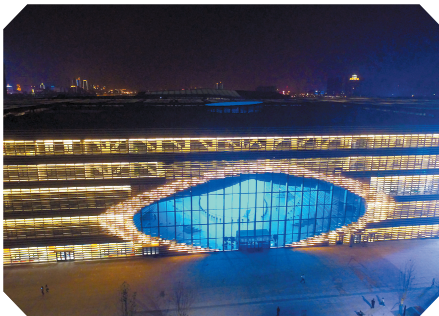
夜晚的天津滨海新区图书馆绚丽多姿