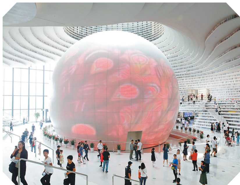
天津滨海新区图书馆中庭“滨海之眼”