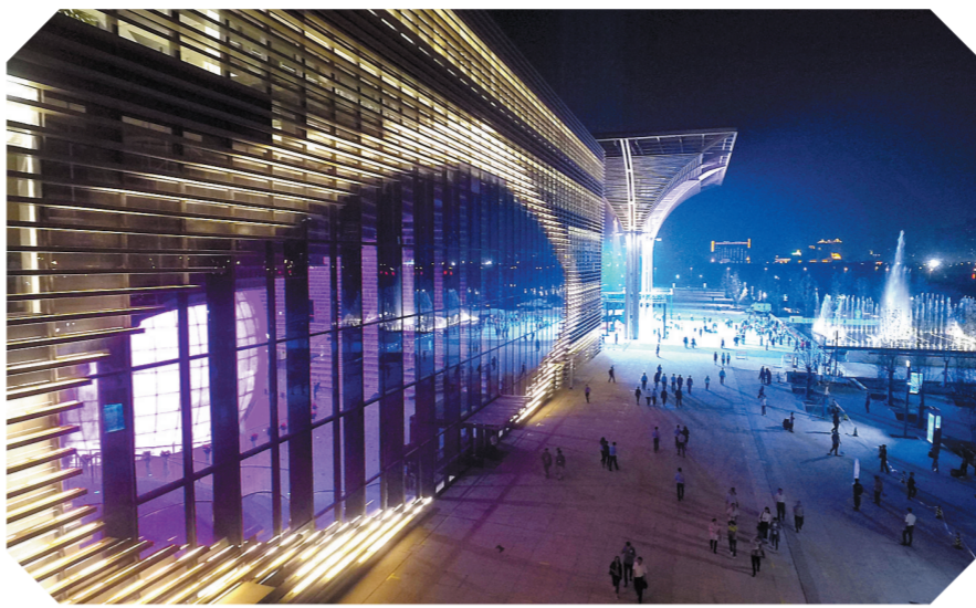
天津滨海新区文化中心夜景