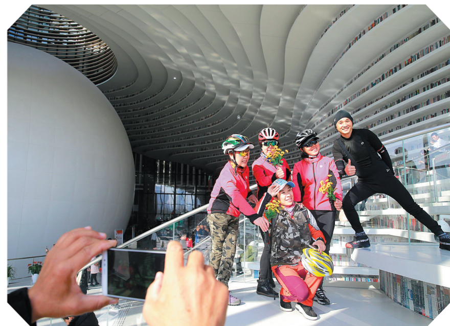
参观者在天津滨海新区图书馆合影留念