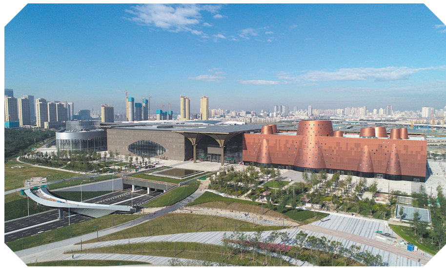
天津滨海新区文化中心外景