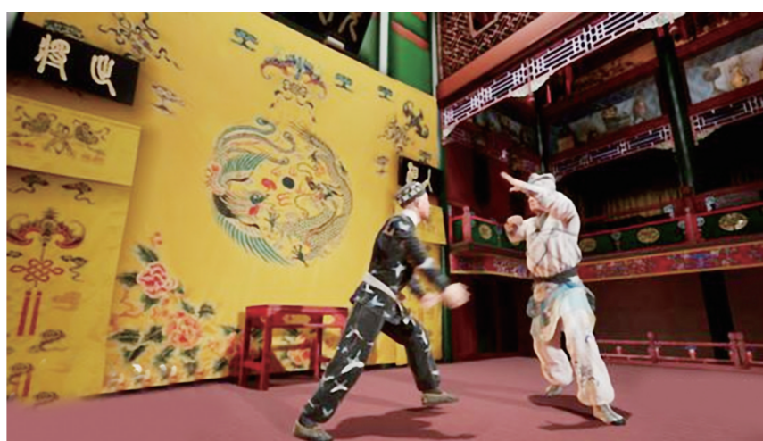
全息京剧《三岔口》拍摄现场

本报讯(记者马霞)1月28日,由北京市西城区委宣传部主办、北京诺亦腾科技有限公司(以下简称“诺亦腾”)协办的“数剧京韵”京剧数字传承与创意体验系列活动启动仪式在京举办。