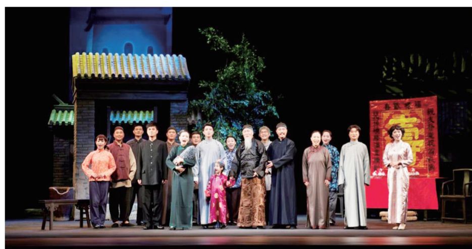
京剧《四世同堂》剧照

本报讯(记者李坤)1月30日(农历腊月廿五),伴随着北京京剧《四世同堂》的精彩上演,第五届天桥小年文化庙会暨老舍京味儿文化节拉开帷幕。本届小年庙会活动持续到2月2日,为观众奉上三部曲剧大戏——《四世同堂》《龙须沟》《正红旗》。此外,庙会还持续往年的非遗民俗的沉浸式体验,让京味儿文化和火爆的年味氛围体现得淋漓尽致。