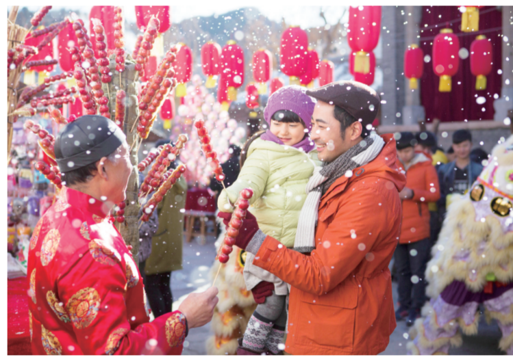
北京古北水镇年味儿浓厚

事实也确实如此,花灯庙会产品和线路十分走俏,越来越多的游客开始回归年味儿。2018年春节,花灯庙会相关景区门票销售同比激增94%。美团门票预测,今年春节,游客将继续追逐年味儿,西安、成都、自贡、开封等年味浓厚的城市将迎来旅游高峰。