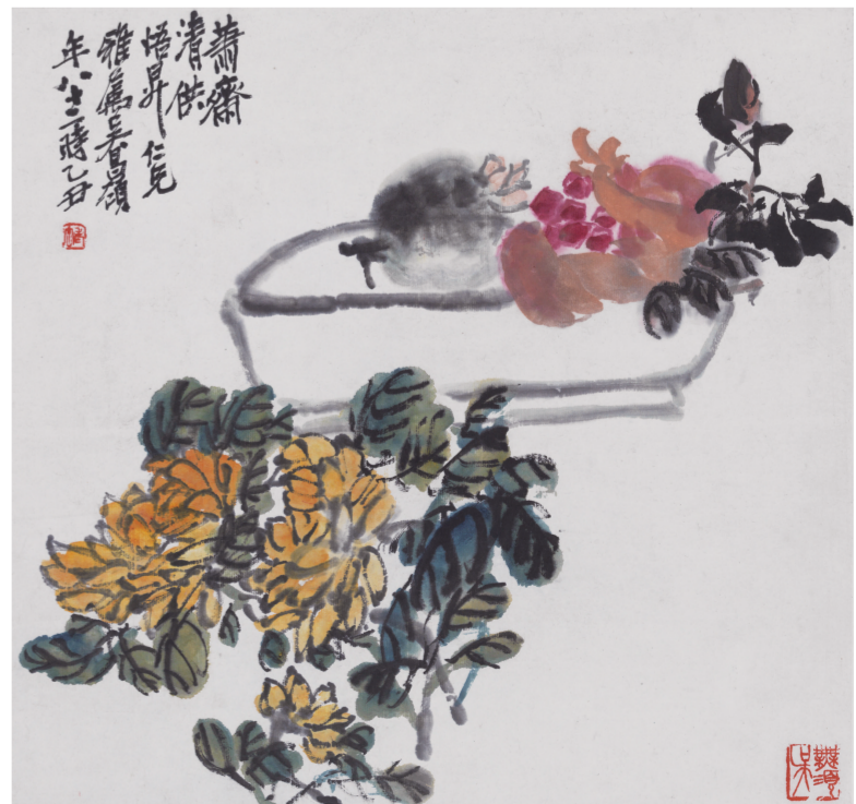
萧斋清供(菊花石榴)(国画) 吴昌硕 中国美术馆藏

郑板桥说:“所谓一块元气结而成石矣。”石之形貌可谓吴昌硕自身精神气质的直观写照。对石的喜爱几乎让吴昌硕把石当作自画像那样来画,画中之石呈现人格化,“奇石苍茫自写看”是也。