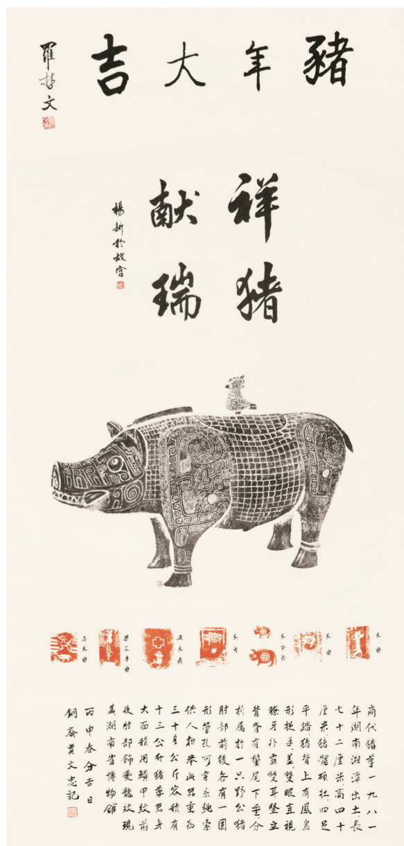
猪年大吉 言恭达 撰 黄建林 书