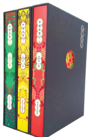
《中国皮影》杨桦林 主编 山东美术出版社 2019年版

为了使蕴含着高度艺术智慧的传统皮影得到更广泛的传播，山东美术出版社与中国美术学院携手推出《中国皮影》3卷，从中国美术学院4.8万余件藏品中精选珍品，同时吸纳了部分中国美术馆、成都中国皮影博物馆、陕西美术博物馆、甘肃环县博物馆等美术馆博物馆藏品和经典的私人收藏，是一次全面、深入、系统的中国皮影分类研究，集详实的皮影资料、精美的图片于一体，可作为广大皮影爱好者、研究者的案头书。