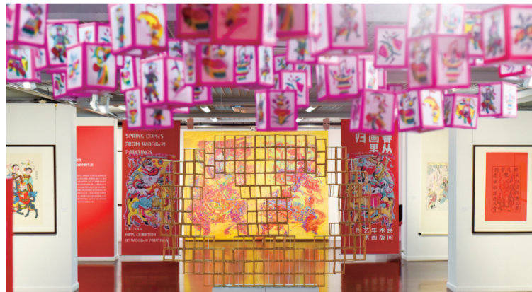
「春从画里归——民间木版年画艺术展」展厅现场

主题展“春从画里归——民间木版年画艺术展”由木版年画和当代艺术两部分组成。木版年画部分分为四个板块，“日常的虔诚——版画中的神祇”展出的是人们日常供奉、祈福所用各种“神”题材的版画作品；“铃印传奇——版画中的故事”主要展出各类以民间故事为题材的版画作品；“纳福迎祥——版画中的生活”展出的版画作品取材于日常生活，如吉祥图案、游戏纸牌、商标广告、蒙学教材、药方、印花布版等；“雕凿方寸——版画制作技艺”主要通过文献