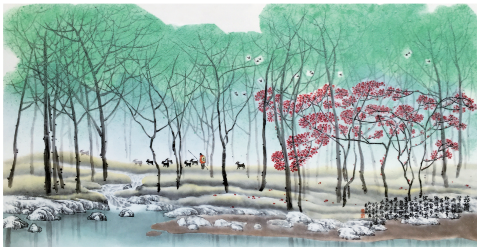
春暖(瓷板画) 冯绍华