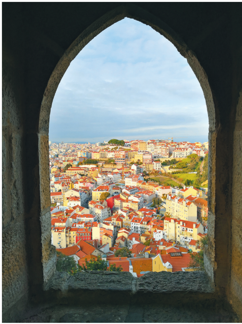
圣乔治城堡窗口的里斯本市容(摄于葡萄牙)

第二,开启航海时代之城。葡萄牙成就了大航海时代,实现了地理大发现,也造就了一个黄金时代的帝国。成就这一番事业的,就是葡萄牙王室。说到航海,不能不提被称为“航海王子”的亨利王子。亨利王子的全名叫唐·阿方索·亨利,生于1394年,是当时葡萄牙国王若昂一世的第三个儿子。他本人并没有真正扬帆远航,只是在1415年参加他父亲若昂一世率领的庞大舰队出征南下,渡海到了今天北非摩洛哥的休征要塞。他坚信葡萄牙发展的机会在海洋。他醉心于研究航海技术,为此放弃了宫廷生活、婚姻、家庭,选择到荒凉的葡萄牙西部萨格雷斯,创办了人类历史上第一所航海学校和一个天文台,为大航海培养了大批技术人才。他运用太阳星相测定航线,从国外招聘专家开设船坞造船,研制了新型帆船,将原来的两桅帆船改造成三桅帆船,使船能更好地利用各个方向吹来的风。他派遣舰队于1418年沿西非海岸南下,先后“发现”了几内亚比绍、塞内加尔、塞拉利昂、圣多美和普林西比,掠得大量黄金、象牙、香料等;1420年,“发现”了马德拉群岛;1431年,“发现”了亚速尔群岛;1438年,进入刚果;1441年,深入非洲,返航时带回了数名黑奴,由此揭开了历史上黑奴贸易;1445年,“发现”了非洲最西端的佛得角,等等。亨利王子于1460年逝世,人们为了纪念他,用葡萄牙国旗上那片绿地向他致敬。亨利王子去世后,大航海已势不可挡。1497年至1498年,葡萄牙航海家达·伽马绕过好望角到达印度,开辟了第一条从欧洲绕过好望角到东方的航路。1519年至1522年,葡萄牙人麦哲伦效力西班牙王室,实现了人类历史上首次环球航行。1960年,在亨利王子逝世500年之际,葡萄牙在里斯本修建了“葡萄牙超级英雄联盟纪念碑”,也叫“大航海纪念碑”或“大发现纪念碑”。整座纪念碑是帆船的形状,碑身雕刻了大航海时代的几十位杰出人物,站在第一位的就是亨利王子,他站立在船头,手托一具三桅帆船模型,凝神注视着前方的大海,身后有32位在各领域对航海作出杰出贡献的代表人物,包括达·伽马、麦哲伦等人。帆船形状纪念碑的船尾部雕刻着一个巨大的十字架,十字竖长横短,酷似一柄长剑。十字和长剑融为一体,喻示当年的大航海时