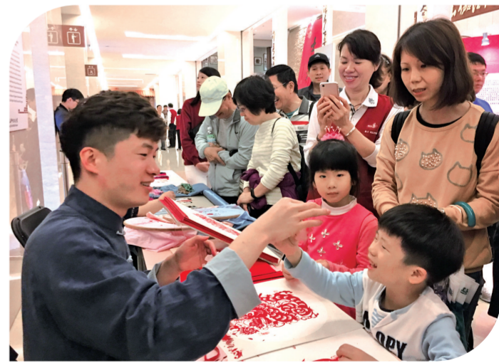
观众与剪纸艺人积极互动

本报 (驻河南记者陈关超 通讯员汪洋)2月20日,“欢乐春节中原文化宝岛行”活动在台湾高雄佛光山圆满结束。本次活动从2月5日开始持续半个月,由河南民俗艺术展、河南美食展、河南文艺演出、河南文化旅游推介会四部分组成,内容丰富,深受台湾同胞追捧。