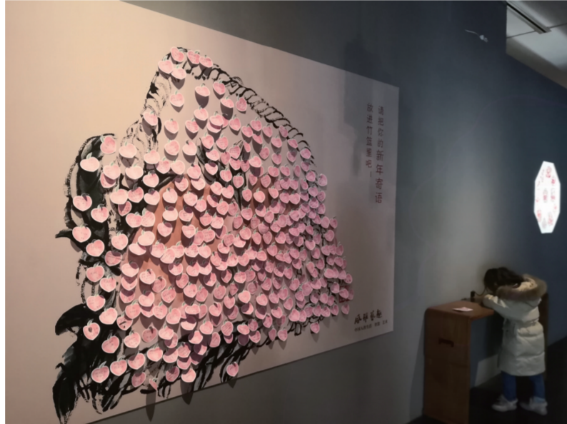
观众在展厅现场参与拓印、剪纸等活动

益社》，关良的《戏剧人物》等，虽然“俗”气，但恰是中国人所期许的美好生活。而美术馆三层则主要展示了文人雅集、读书、临帖、赏雪、品茗的场景，如仇英