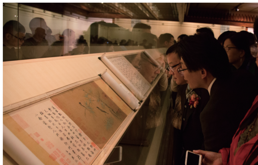
观众在“丹青宝筏：董其昌书画艺术大展”现场认真端详

此次展览分为“以古为师：董其昌和他的时代”“宇宙在手：董其昌的艺术成就与超越”“一代宗师：董其昌的艺术影响与作品辨伪”三个部分。其中，“以古为师”主要包含两条线索，即董其昌的古书画鉴藏(包括其师友在内，曾经鉴藏并对他的画学理论、创作探索产生影响的古代书画家代表作品)，以及对董氏艺术、人生与画学思