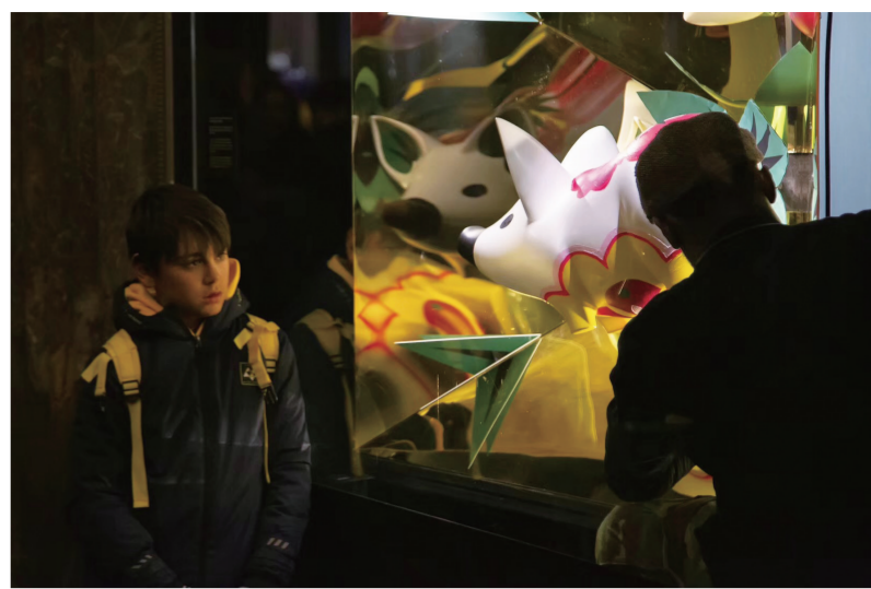
纽约当地民众观看“棱镜泥猪”橱窗

围绕这样的话题,我希望引发的思考是:大学如何涵养自身,如何通过涵养自身来涵养社区、社区公民和城市?只有具备这样的思考与实践,我们的社区与城市才能因为大学美术馆与博物馆的独特贡献而发展得更好。