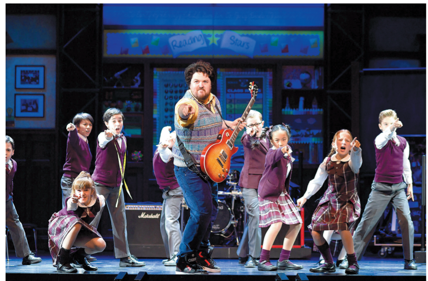
音乐剧《摇滚学校》上海首演剧照

随着在沪首演成功,《摇滚学校》将在上海进行为期4周的演出,并将于3月22日至4月14日转战北京天桥艺术中心,连演29场。