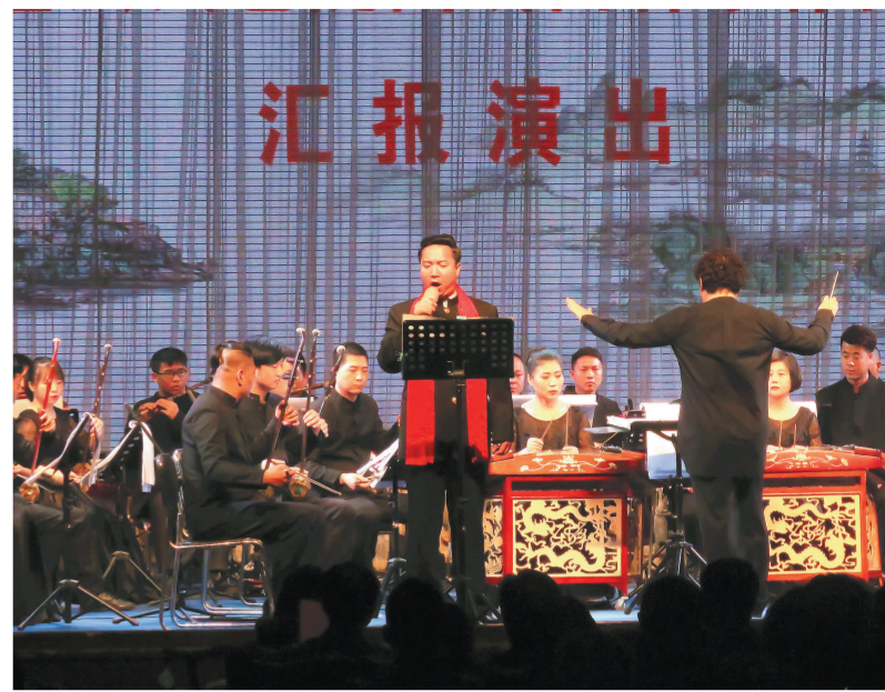
结业汇报演出

本报讯(驻陕西记者秦毅)2月27日晚,2018年陕西省基层文艺院团戏曲音乐作曲研修班结业汇报演出在西安易俗社小剧场举办,30名县级国有文艺院团的艺术骨干用最新创作的作品诠释了他们为期半年的学习成果,这也标志着2018年陕西省基层文艺院团戏曲音乐作曲研修班圆满结业。