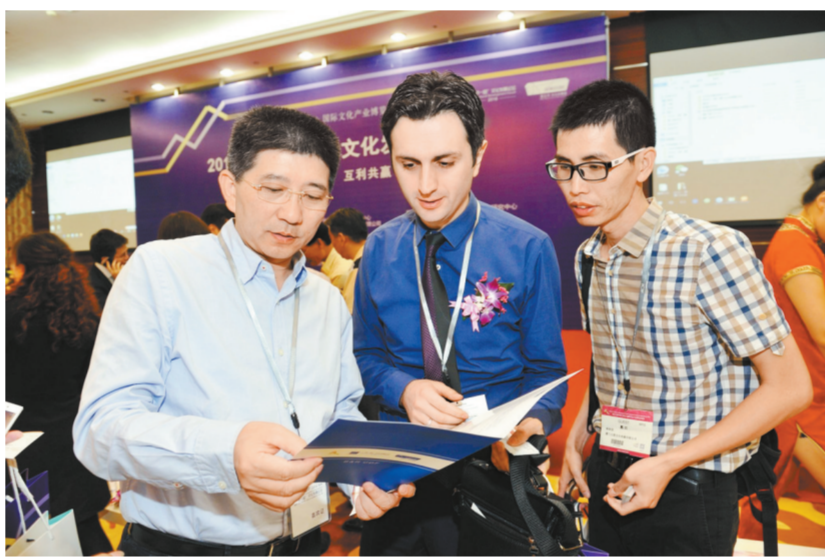
中方企业代表与土耳其企业代表在第十四届深圳文博会上进行商务洽谈

深圳文化产业门类齐全,已经形成了创意设计、文化软件、动漫游戏、新媒体及文化信息服务、数字出版、影视演艺、文化信息服务、数字出版、影视演艺、文化旅游、非物质文化遗产开发、高端印刷、高端工艺美术等十大重点领域,产业综合实力不断增强,成为国内文化创意产业发展的先锋城市之一。