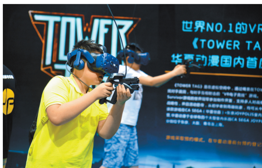
参观者在第十四届文博会上体验最新VR(虚拟现实)电竞

接下来,深圳将制定出台促进文化产业高质量发展的政策措施,明确未来发展目标和发展重点,优化产业发展环境,深化与粤港澳大湾区的合作,巩固深圳文化产业在全国领先的地位;加强文化产业园区建设,促进产业集聚发展,提升改善文化产业园硬件环境,建设更好技术平台,聚集一批优秀文化企业形成示范带动作用;加大资金支持,对重大文化企业活动项目、龙头企业、优秀品牌予以重点扶持,解决中小企业融资难问题,支持文化企业上市融资,为企业提供创新、专业、精准的金融服务;做大做强文化产业市场主体,实施总部引领,吸引国内外龙头企业把基地设在深圳,打造一流现代文化传媒集团,培育本市骨干文化企业,加强前海深港设计创意园、华侨城甘坑新镇、文博会产业园、大芬油画村等一批重大产业项目建设;完善和优化产业公共服务平台,通过政府扶持、企业主体、市场运营的方式,加快搭建完善平台,为产业主体提供信息、贸易、技术和投融资等方面的服务,支持文化企业参加重要国际文化展,与有实力文化机构展开合作,促进行业创新和发展。