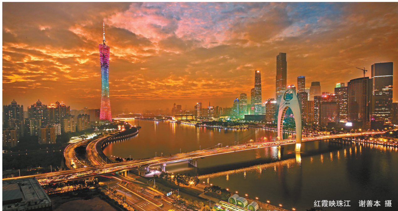
红霞映珠江

同时,文化会展交易平台效能不断提升。第十四届深圳文博会总参观人数733万人次,实质性成交2338亿元,刷新历史记录。广东国际旅游