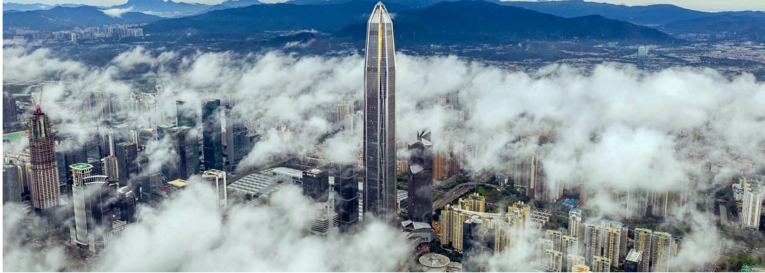
湖山拥福，田地生辉。抢抓粤港澳大湾区建设重大机遇，福田正以前所未有的大视野进行布局。