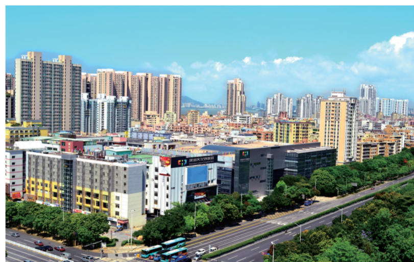
深圳文化创意园是深圳中心区最大的综合性文化产业集聚区

如果说福田区在本届文博会上向世人展示的湾区标杆性特色文化如一朵朵或含苞欲放或迎风怒放的花儿，我们有必要沿着一路芳香，找寻那田万紫千红的花海。