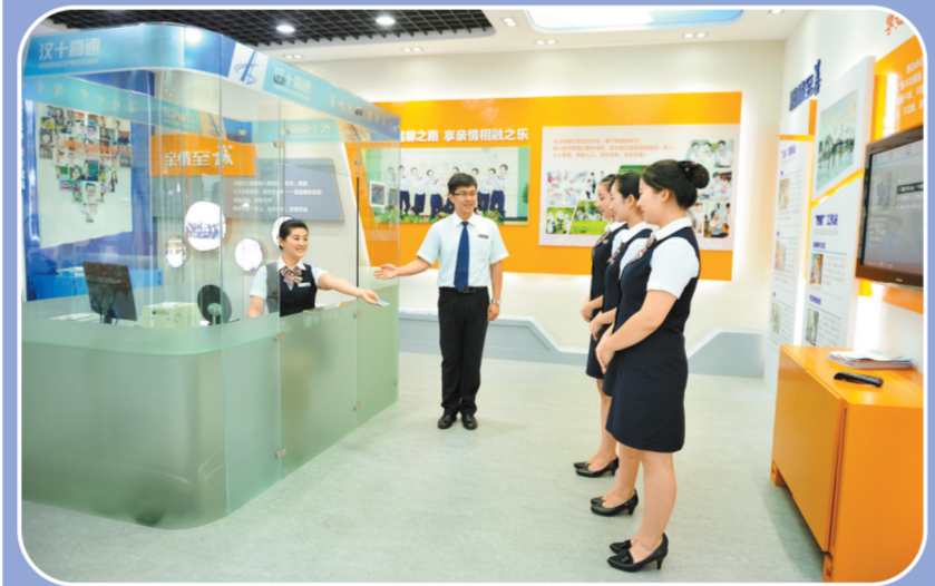
汉十高速温情工坊培训基地