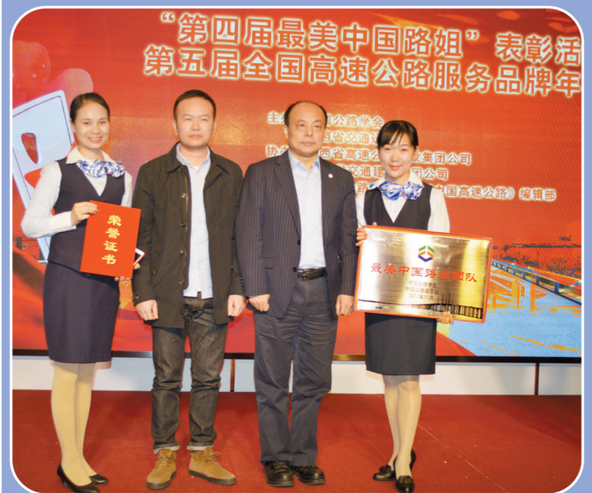
2017年10月30日，汉十管理处随州管理所“温情驿站”团队获“中国最美路姐团队”荣誉称号，是湖北唯一一家获得该奖项的单位。