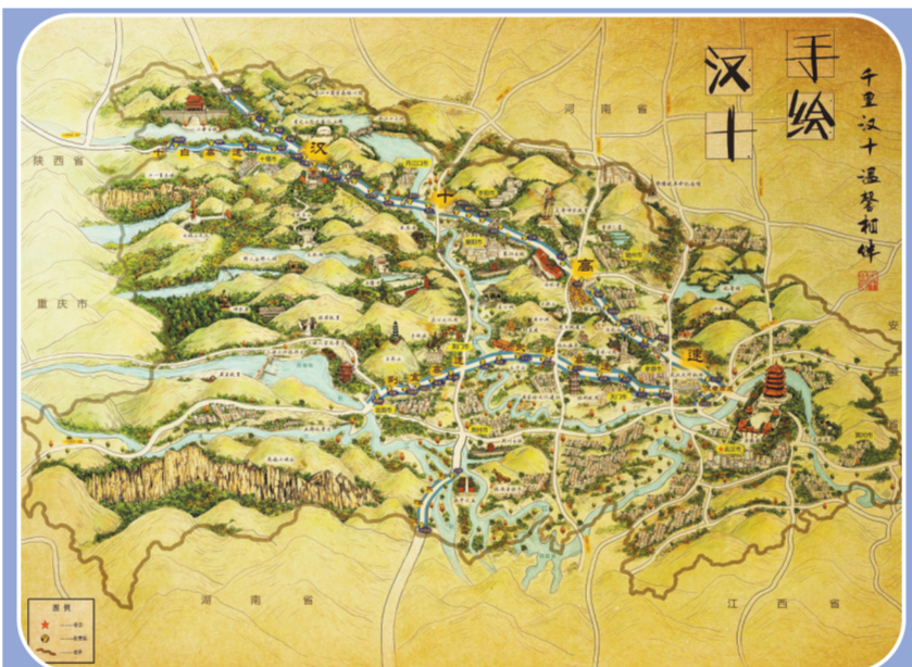
汉十高速公路手绘地图