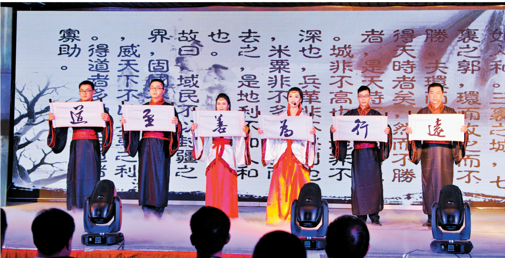
“书香汉十”青年读书品牌展示活动

汉十的文化自信来自于民本情怀。进一步说，无论是打造特色“子文化品牌”，还是加快实施“文化设施”，抑或是举办“汉十文化周”等大型文化活动，最终的落脚点就是以便让广大社会群众更好地关注和参与，既可以感受到中华传统文化的亲和力，又彰显汉十文化及其子文化群的多样性，呈现出汉十文化开放共融的姿态，提升“精气神”，不断升级高速公路公共文化服务质量和效能。