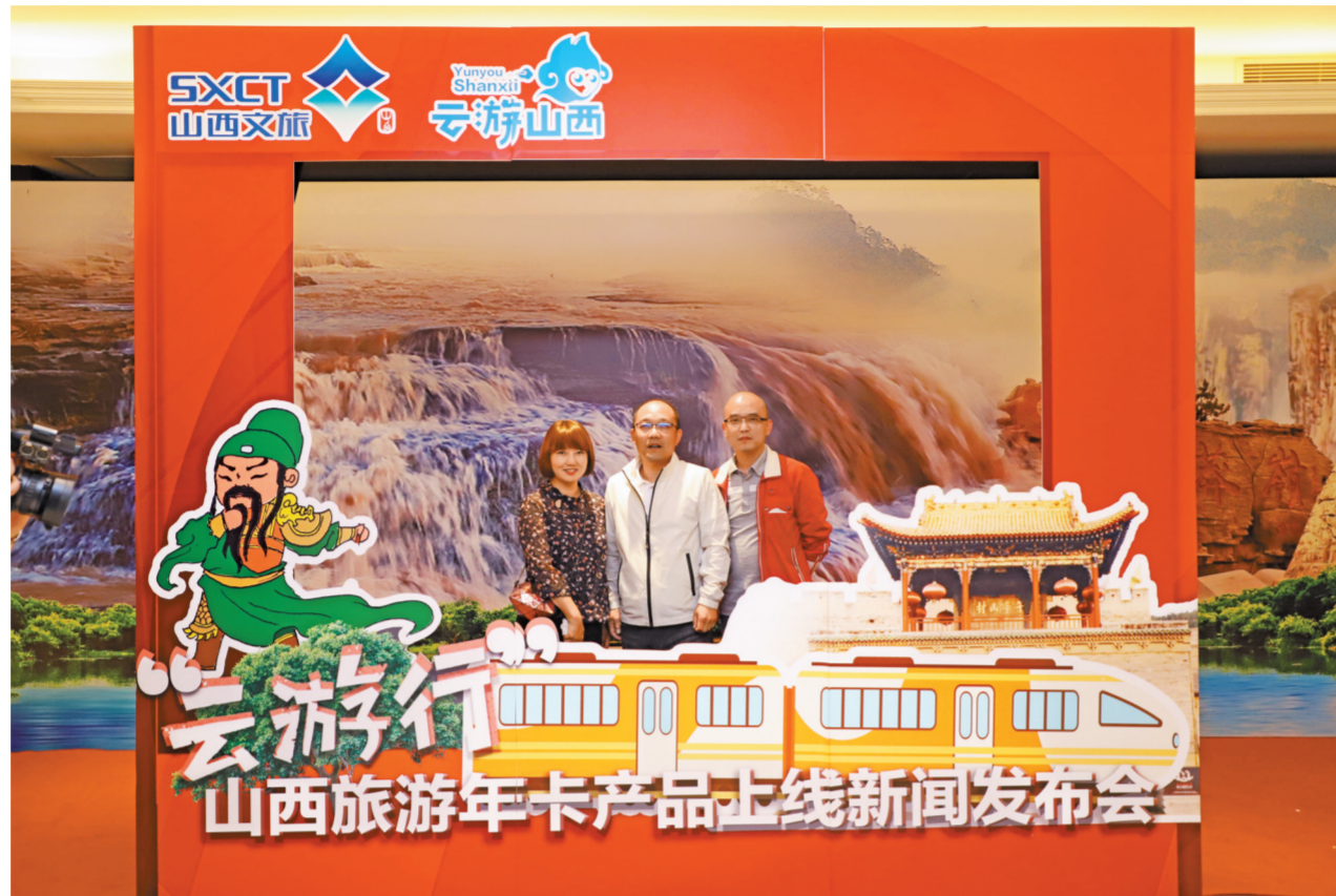
山西云游卡发布会

除了传统门票功能外，腾旅年卡可以通过身份证、二维码、人脸等多种方式识别游客，同时提供手机导游、景区直通车、交友、住宿、景区二消门票、会员品质跟团游等多种服务，从线上到线下，从游园前到游园后，全方位服务用户。