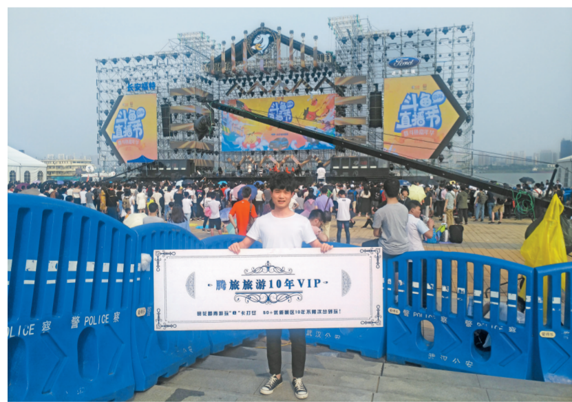
腾旅旅游携手斗鱼发布会活动现场