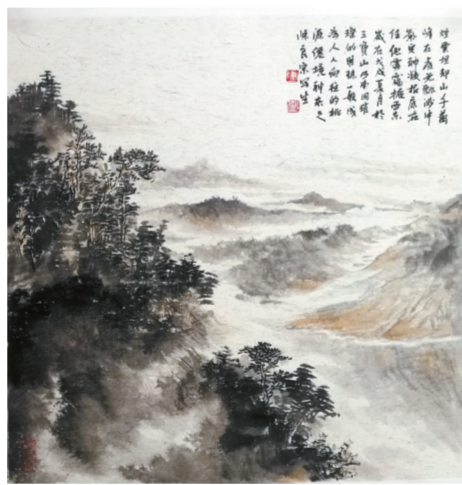
烟云埋却山千万(中国画) 50cm×50cm