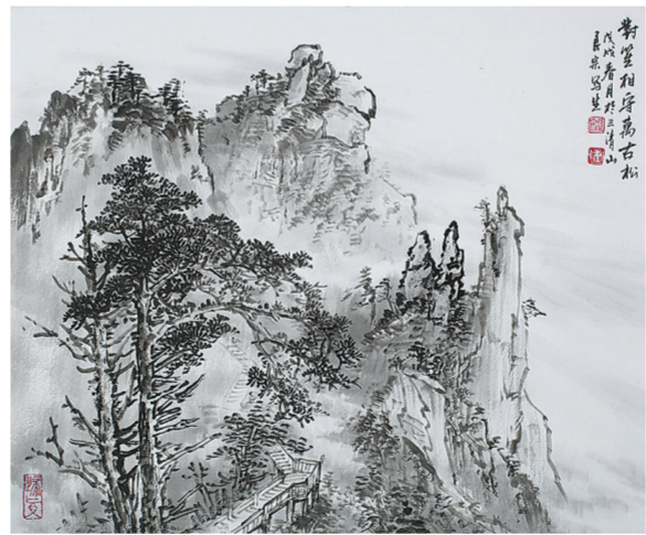
对望相守万古松(中国画) 38cm×45cm