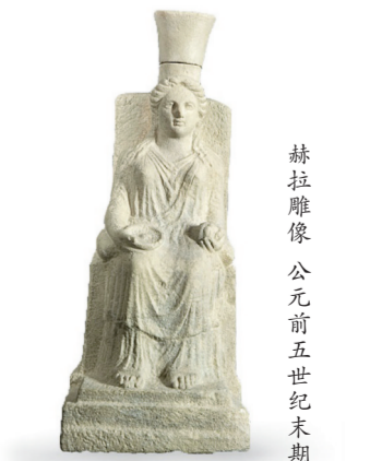
赫拉雕像 公元前五世纪末期

据悉，为了让观众更为深刻地感受希腊文明，中华世纪坛将举办一系列的公共教育活动，如儿童剧演出、学术讲座、教育活动、音影体验活动等，致力于为首都“文化中心建设”打造“世界艺术之窗”。