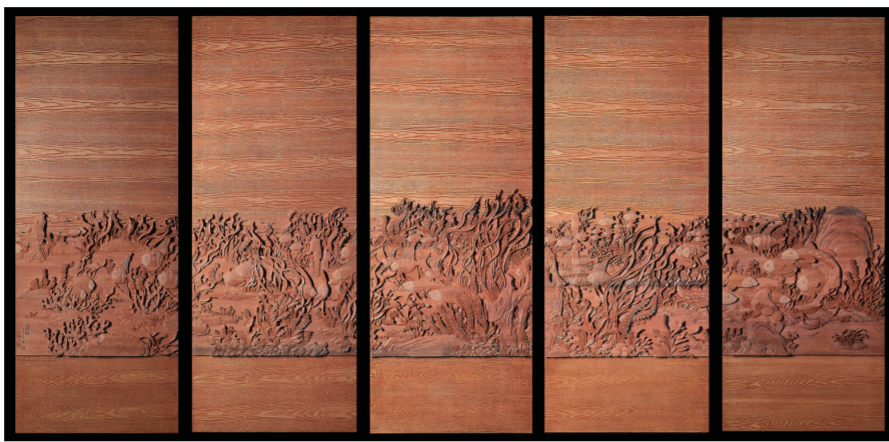
遨游(木雕) 2019年 黄小明

除经典作品外，黄小明还专门为此次展览创作了8组35件新品。其中，《山水十二条屏》长达9米，12幅中华山水画面被雕刻于12个折扇弧形落地屏风之上，它们整体类似传统东阳木雕的板雕，但在许多景致的细节中，黄小明又将镂空雕、浮雕等手法融合其中。表现大漠的《永恒的丝路》在传统基础上