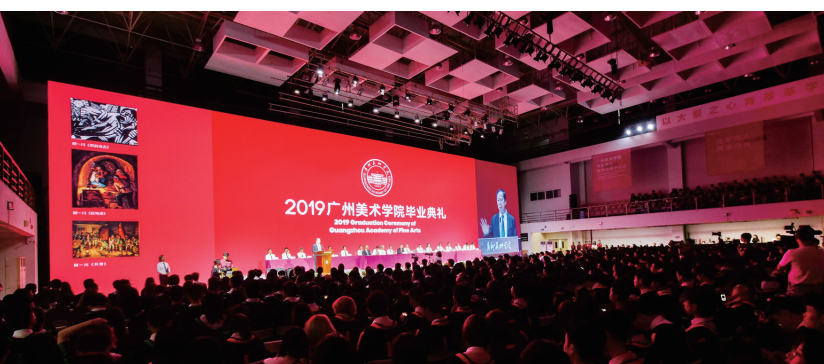
广州美术学院2019年毕业典礼现场

在中国近现代绘画史上,岭南画派顺应时代巨变,高举革新旗帜,不仅刷新了中国画的面貌,也在折衷中西的画法上别开生面。黎雄才先生生长在一个书画家庭,17岁因天资聪颖,受到高剑剑的赏识,进入春睡画院学