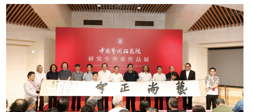
中国艺术研究院2019届研究生毕业作品展开幕式现场

第二,做一个纯粹的艺术家人。我们首先要做一个纯粹的人,只有纯粹才能高尚,只有纯粹才有可能成功。做到纯粹首先要减少自己的欲望,欲望是悬在头上的一把刀,十分危险。它让我们变得庸俗,严重毁灭人性,我们的一生中要时刻警惕欲望的袭击。当一个好的艺术家人消除欲望变得纯粹,这将是你