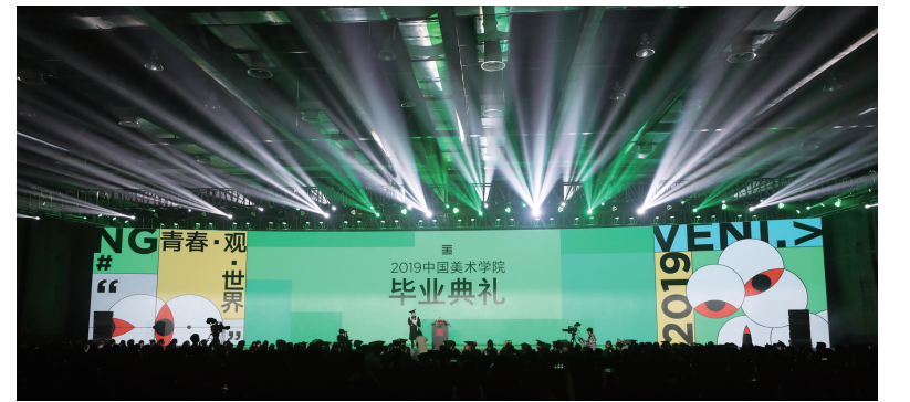
中国美术学院2019年毕业典礼现场

们说:世界是一种真实的同时又宽广无边的存在,有说世是时间,界是空间;有说世是实存,界是兴发。世界总会带给我们两元的思考。因此,世界不仅是具有无限性和统一性的存在,更是一极两元的思想和认知的原形。秉持这种原形的思想模式,我们将冷暖、虚实、方圆、巨细、刚柔、山水、仁智、荣枯变为互动兴发的生命的尺度,来感受我们的生活,判断我们的价值,建构我们对于生活世界的最初原型的诗性方式。所以,我们要以青春如歌的目光关注世界,关怀世界,又要以世界的可感而又无限、大道无穷而又应感兴发的特性来反观青春,驾驭青春。如是,我们将获得真正的自由、心灵的自由。