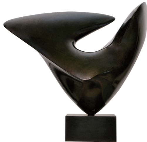
永恒(雕塑) 安东尼·彭赛

们独具特色的塑造语言和艺术风格。其中，克罗德·阿巴吉毕业于巴黎国立高等装饰艺术学院，曾获法国“布德尔雕塑奖”，2014年当选法兰西艺术院轮值主席。其作品融汇古典与现代理念，以其原创性的符号化衣纹表现了他对“人”的深刻认识与思考，理性、诗性构成他作品的特征。让·卡尔多长期任教于里昂和巴黎高等美术学院，并在1992年至1997年期间担任法兰西艺术院主席。他以简约而富有生命张力的艺术语言为20世纪的众多伟大人物创作了一系列经典雕像，在“人”的主题上建立了自己强韧的不朽风格。让·安哥拉曾求学于巴黎国立高等美术学院建筑系，2012年获得“西蒙娜和奇诺·德尔杜卡基金会奖”，他作品的形体包含自然的伟力，在人和山峦大地的对话中创造了独特的雕塑语言形式。安东尼·彭赛是法国国家奖学金获得者，曾担任“布德尔雕塑奖”评委，他以对客观世界