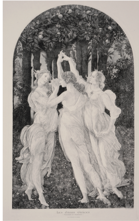
波提切利的三位圣宠(铜版画) 桑德罗·波提切利