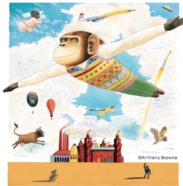
梦想家威利(插画) 1997年 安东尼·布朗

展览期间，主办方还将举办讲座、艺术沙龙、插画课堂和工作坊等活动，给观众带来更多的审美体验和互动感受。展览开幕同期，中信出版集团还发布了安东尼·布朗在中国的首部个人作品集《安东尼·布朗的幸福博物馆》，该书汇集了其创作绘本的40年经历、作家生平、作品解析等内容。(施晓琴)