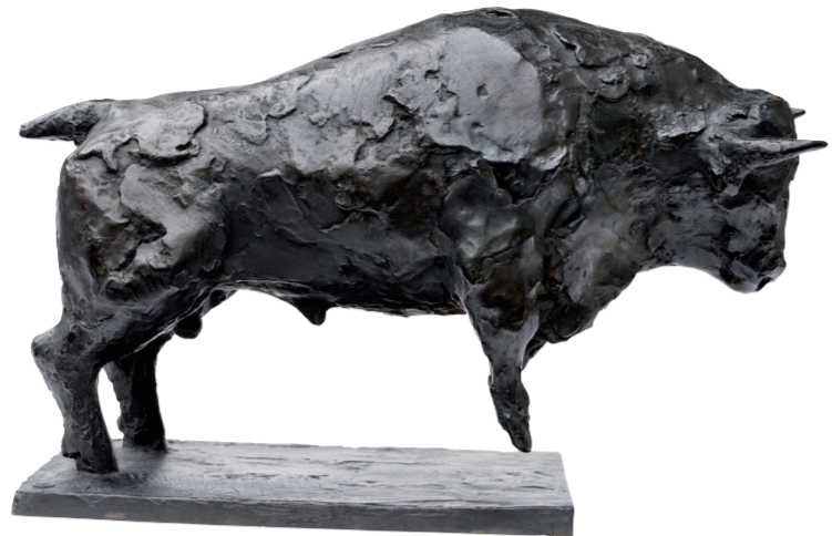
埃斯特卡尔公牛(雕塑) 让·卡尔多

这些作品主题多样、形式丰富，具有超越时代的探索性，展示了5位雕塑大师对于生命与情感、内容与形式、写实与抽象、人与自然、西方与东方等诸多文化问题的多元审美观照，凸显了他