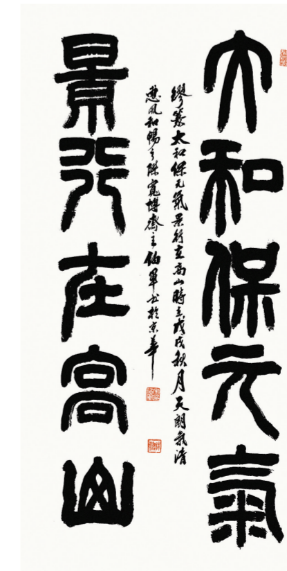
《太和保元气，景行在高山》(篆体) 168厘米×68厘米