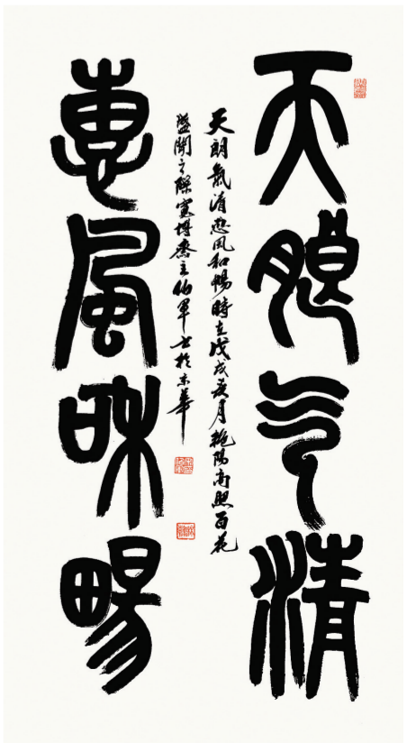
《天朗气清，惠风和畅》(小篆) 138厘米×68厘米