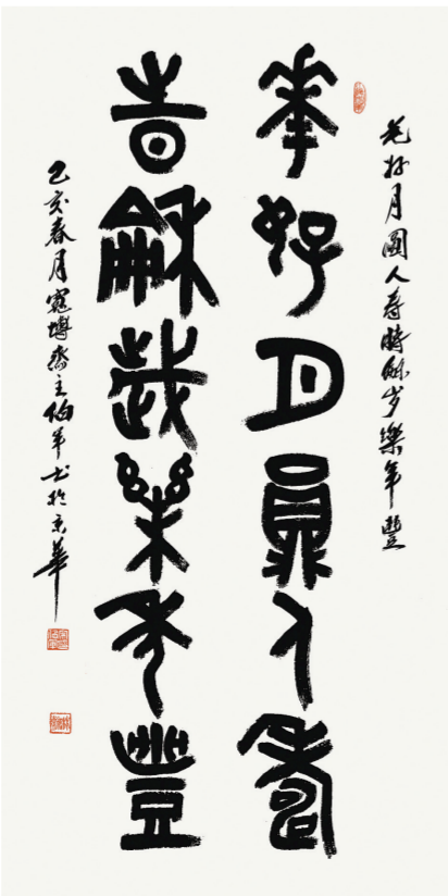
《花好月圆人寿，时和岁乐年丰》(大篆) 138厘米×68厘米