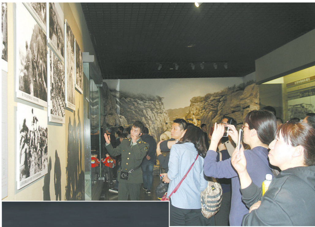
▲ 观众在八路军太行纪念馆参观