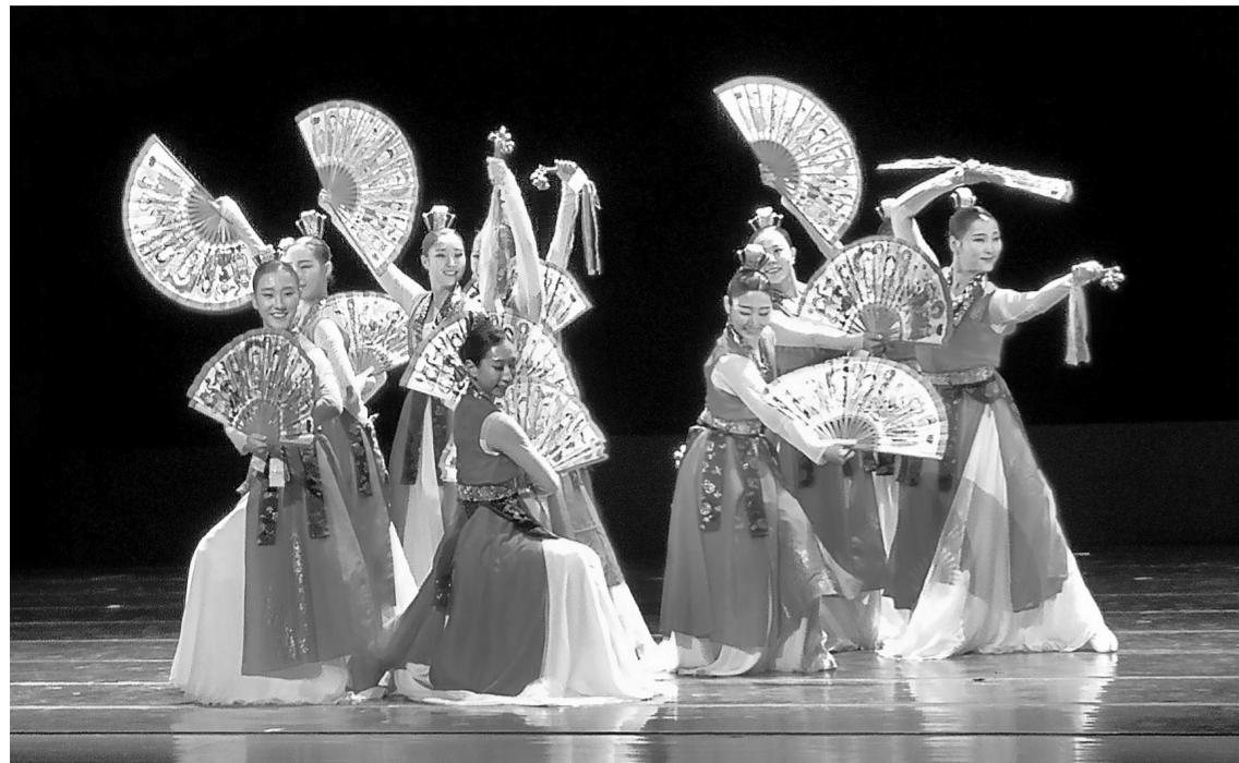
展演中,韩国国立体育大学演出舞蹈《巫具舞》。

7月2日,一场别开生面的“面向未来的亚洲艺术——2019亚洲国际文化艺术展演”在北京中国戏曲学院大剧场举办。来自中国、美国、韩国、法国、澳大利亚等10余个国家和地区的师生代表共同观看演出。作为由北京师范大学和中国戏曲学院联合主办的“面向未来的亚洲艺术——2019亚洲国际文化艺术论坛”的重要组成部分,本次展演期间,北京师范大学、中国戏曲学院、中国音乐学院、北京语言大学、韩国国民大学、韩国国立体育大学、韩国晋州教育大学等中外高校的演出团队用京剧、舞蹈等多种艺术形式,谱写了推动亚洲文化艺术交流互鉴的新乐章。