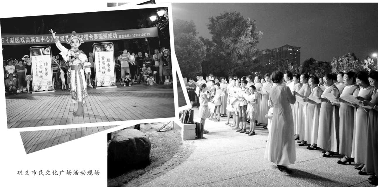
巩义市民文化广场活动现场

被誉为巩义版《星光大道》的“河洛大舞台”是市民文化广场的又一道风景。“河洛大舞台”试行市、镇、村三级联动,在市区设主会场,各镇设分会场,从村到镇再到市层层推选优秀节目,有效激发了基层文化力量的释