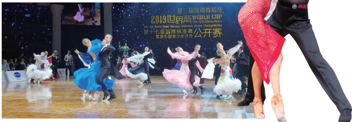
舞者翩翩起舞似一朵朵盛开的鲜花

本次大赛中世界最高水平的国际四大组别（职业摩登、拉丁，甲A摩登、拉丁）阵容强大，选手中不乏一些“熟脸”，如2019英国黑池的职业摩登冠军安德里·吉贾雷利和萨拉·安德拉奇奥、甲A摩登冠军费多伊塞夫和安娜·朱迪丽娜、甲A拉丁冠军费迪南多·伊纳科内和尤利亚·