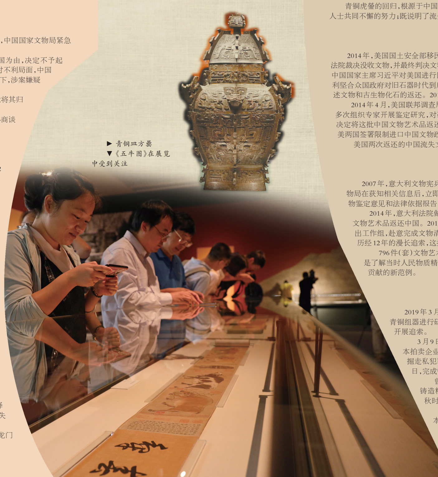
▲ 青铜方罍 ▼ 《五牛图》在展览中受到关注

龙门石窟是中国北魏晚期至唐代最具规模和最为优秀的造型艺术，代表着中国石刻艺术的高峰。龙门石窟流失文物的回归，为恢复这一中华民族文化瑰宝和世界遗产的完整性作出了重要贡献。