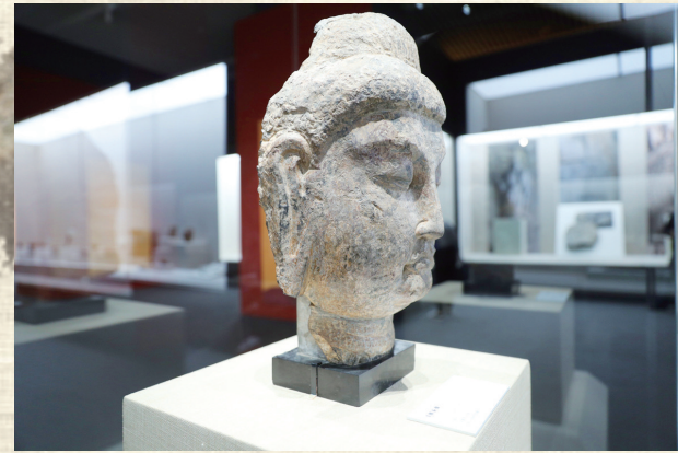
龙门石窟石刻佛首

此后几年间，“文物小组”有计划地征集了唐韩偓《五牛图》、五代董源《潇湘图》、五代顾闳中《韩熙载夜宴图》（宋摹本）、宋徽宗赵佶《祥龙石图》等重要文物。