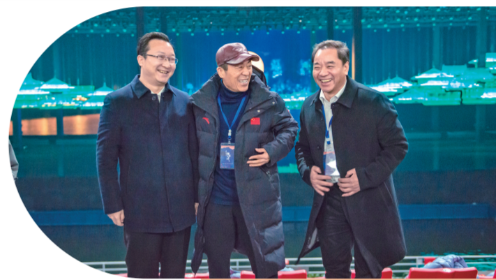
张艺谋导演与奉节县委书记杨树海(右)、县长祁美文(左)一起观看《归来三峡》。