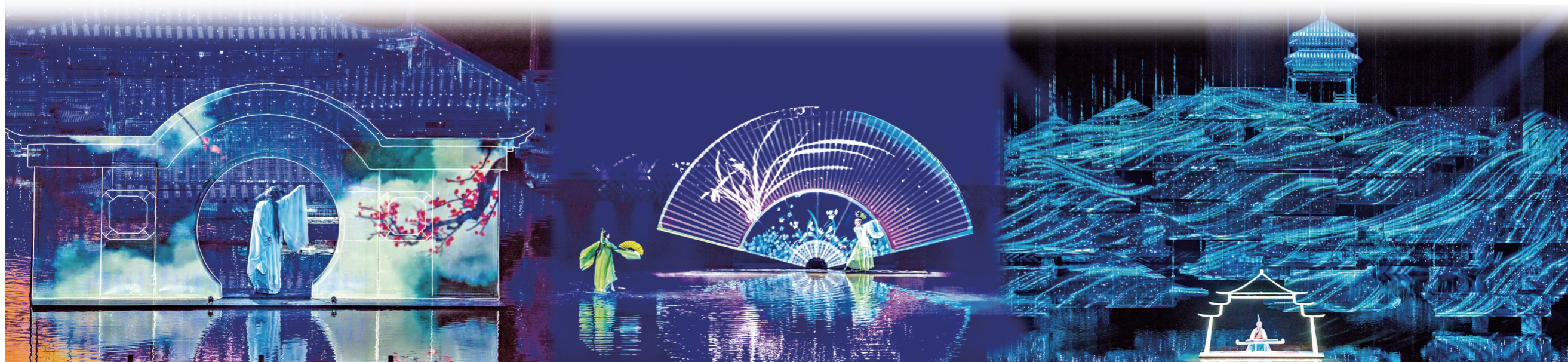
《归来三峡》大型诗词文化实景演艺剧照