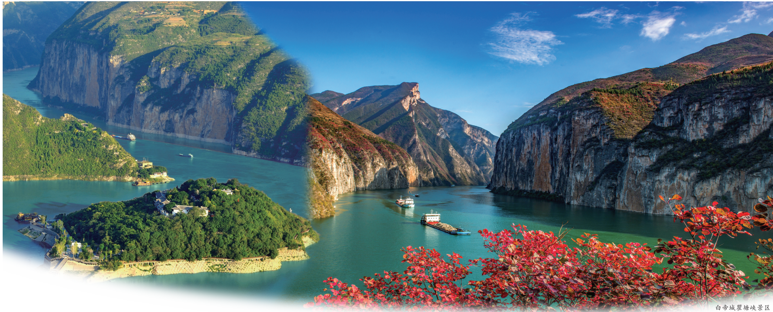
白帝城瞿塘峡景区